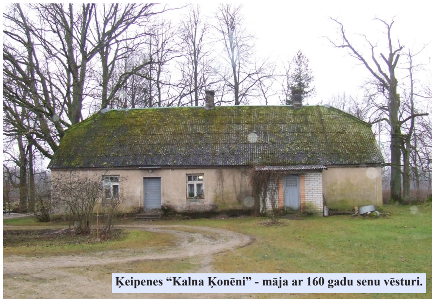
Ķeipenes “Kalna Ķonēni” - māja ar 160 gadu senu vēsturi.