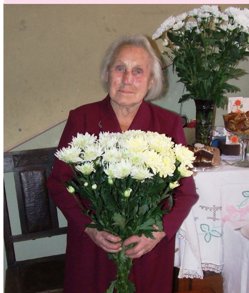
... un 90. dzimšanas dienā