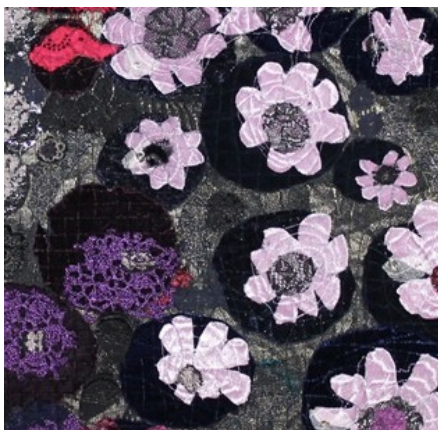
Fragments no gleznas crazy-wool tehnikā

Zvaniet Baibai, tālr.26421735, un piesakieties! Lūzdu to izdarīt pēc iespējas ātrāk!