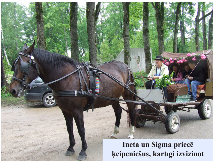
Ineta un Sigma priecē ķeipeniešus, kārtīgi izvizinot