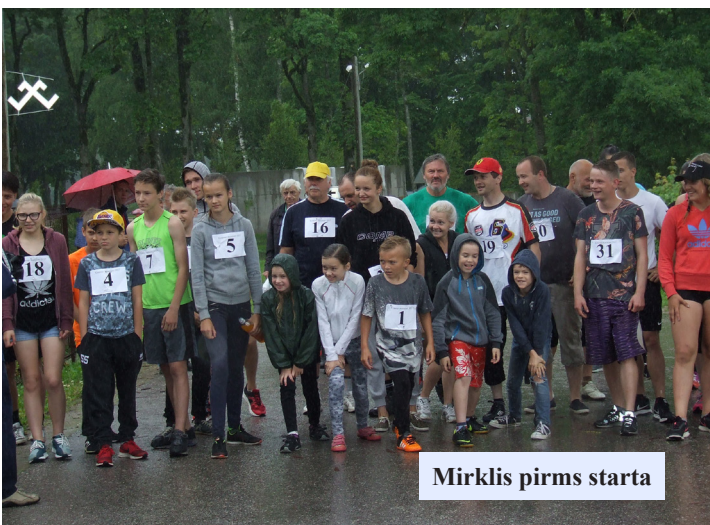
Mirkļis pirms starta