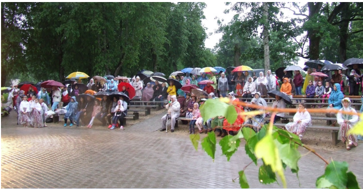
Lietus bija nobiedējis sadanča skatītājus, bet ne deļotājus