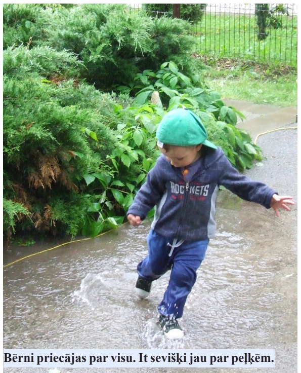
Bērni priecājas par visu. It sevišķi jau par peļķēm.

I.L. – Man jau šķiet, ka mierīga, ir pieradusi pie cilvēkiem. Dunduri gan viņai ļoti nepatīk. Dunduru laikā paši aizvelkam uz lauku darba ratus, piekraujam ar sienu un tikai tad tajos iejūdzam zirdziņu, lai aizvelk siena vezumu mājās. Tas viss nejauko, kodīgo dunduru dēļ. – Svētkos pamanīju, ka ratiem jumtiņš, tie skaisti izpušķoti ar pujenēm.