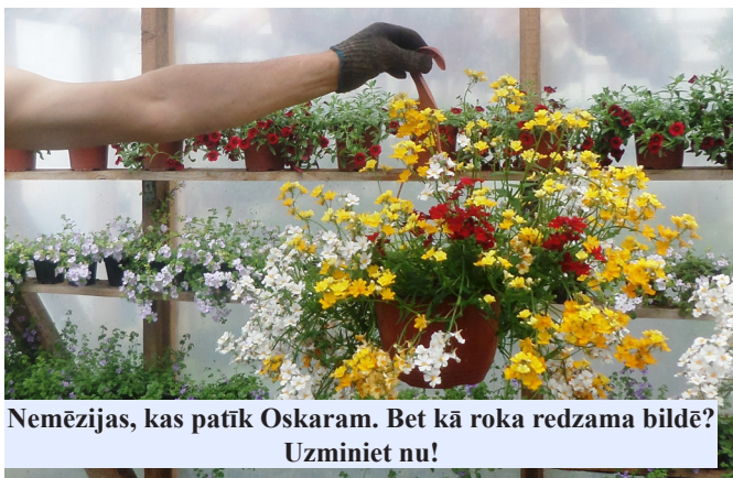
Nemēzijas, kas patīk Oskaram. Bet kā roka redzama bildē? Uzminiet nu!

Pasaulē ir daudz skaista un dvēseli iedvesmojoša. Viena no skaistākajām dabas dāvanām ir ziedi. Kad dzīves nemiera jūra grasās aizraut nebūtībā tavu sirdsmieru un ikdienas pelēcība aplāj visu tavā apkārtnē, iebrien ziedošā pļavā, pacel acis uz plaukstošu ābeli vai ievu, paver aizkaru un paveries kaktusa krāsainajos ziedu kausos uz palodzes, un tava pasaule pārvērtīsies. Tā kļūs krāsaina, smaržīga un harmoniska, tevī ienāks miers un prieks, un apbrīna, ka ir kaut kas tik skaists un pilnīgs, un daudzveidīgs kā ziedi.