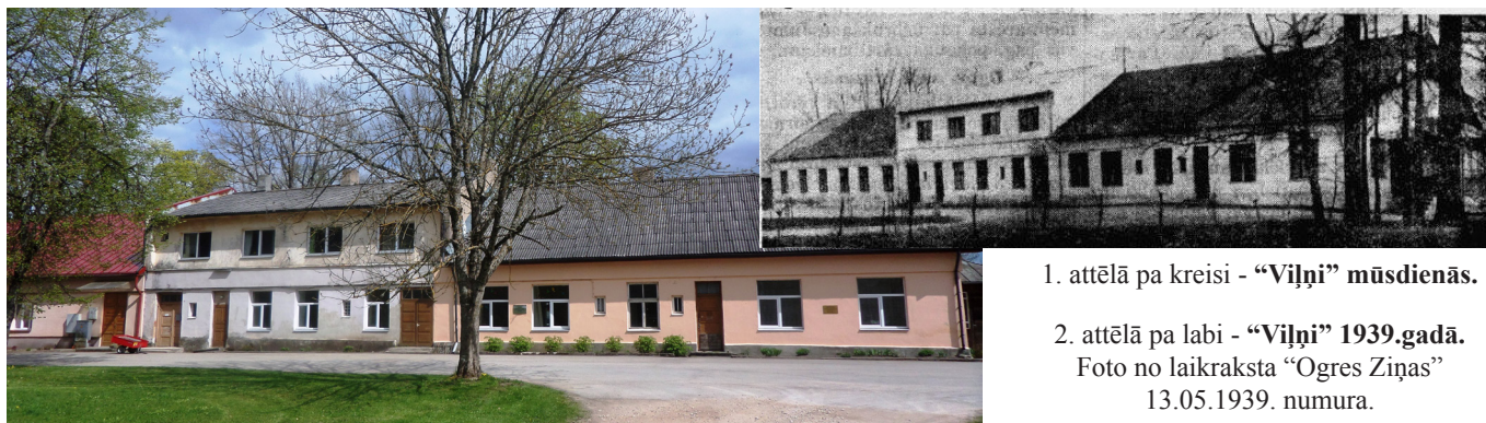
1. attēlā pa kreisi - “Viļņi” mūsdienās.