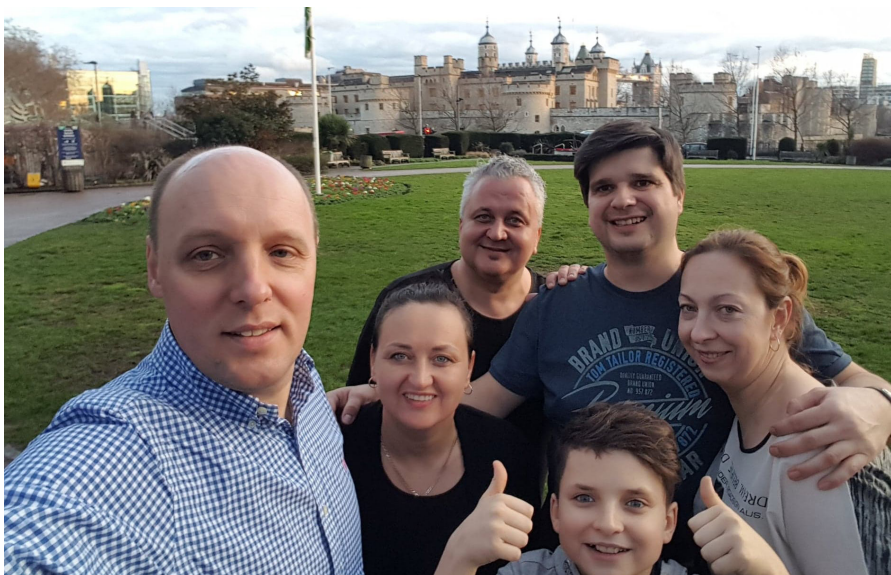
Pie Janeka ciemos atbraukuši draugi. Vienu no draugiem jūs noteikti pazīsit!

Ziemassvētku dienā nekursē absolūti nekāds transports, izņemot lidmašīnas. Cilvēki pavada šo dienu mājās. Skatās Ziemassvētku filmas, spēlē spēles.