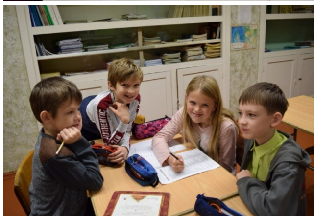
Ķeipenes pamatskolas skolēni mācību darba procesā