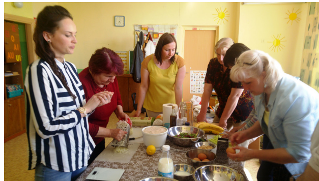
Veselīga ēdiena gatavošanas meistarklasē 7.maijā