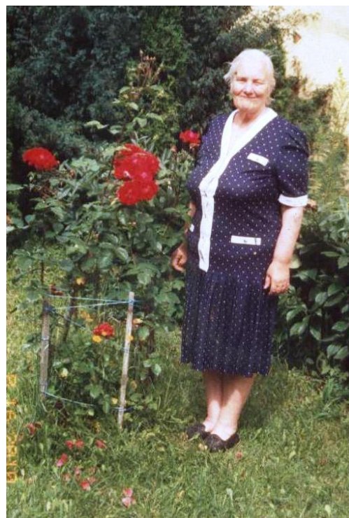
...un pāris gadus atpakaļ