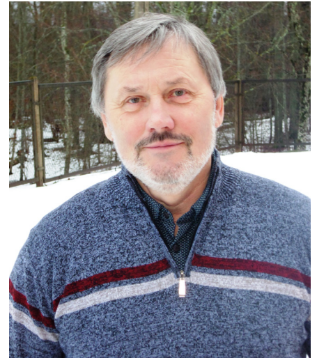
Ķeipenes ceļu fonda vadītājs

Pašvaldības ceļu un ielu uzturēšanai saņemam no valsts mērķdotāciju. Nozīme ir tam, ka cenšos nopelnīt un arī nopelnu vēl papildu līdzekļus. 2017.gadā ar autogreideru sniedzu pakalpojumus ceļu