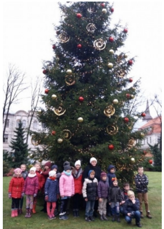
Mēs pie Prezidenta pils egles

Nu jau ir atnācis 2018. gads - ar jaunām