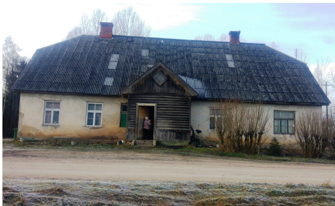
“Vecdiedziņš” - bijusī nespējnieku māja- no abām pusēm - no ceļa puses (augšējā attēlā) un no otras puses (apakšējā attēlā)

Bet Vecgada vakarā man ir dežūra, tā kā nekāda svinēšana