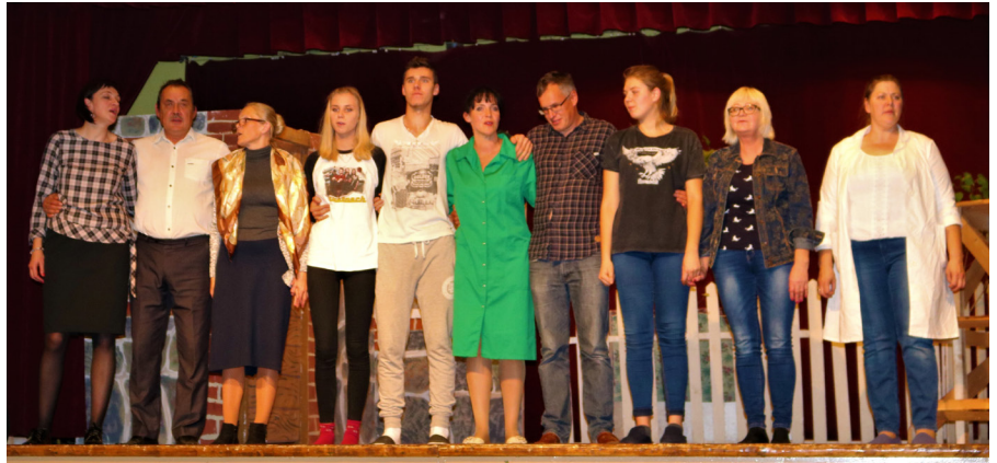
Ķeipenes amatierteātra aktieri - izrāde "Kalnu Tāle" beigusies, skan pelnīti aplausi

Vispār – Ķeipenes amatierteātris ar katru gadu progresē, un, manuprāt,