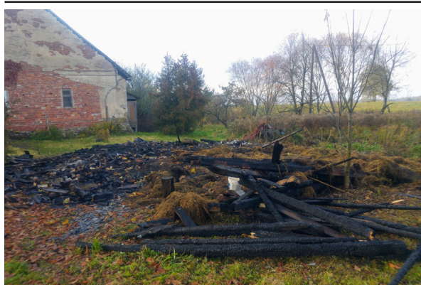
Tik vien "Kārklos" palicis no šķūniša - apdeguši balķi

Dokumentus var iesniegt jebkurā VSAA nodaļā.