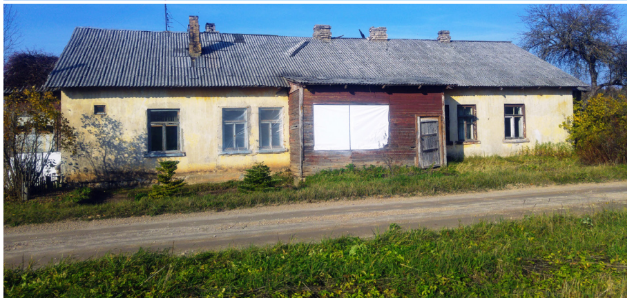
Kādreizējā dzelzceļa strādnieku māja, tagad saukta par Dzelzceļa māju 62.km, celta 1950.gadā

Un tā – par „Dzelzceļa māju 62.km”. Te vispirms jārunā par dzelzceļa līnijas Rīga – Ērgļi vēsturi. Šī dzelzceļa līnija sāka būt 1930. gadā. Vispirms izbūvēts dzelzceļa posms no Rīgas līdz Suntažiem, tā svinīga atklāšana notikusi 1935.gada 26.novembrī.