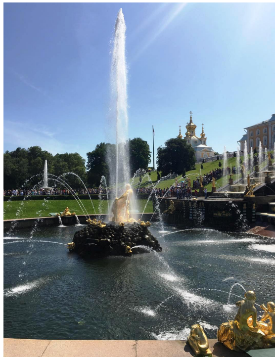
Sanktpēterburgā ir daudz skaistu strūklaku

Veikalus „neķemmējām”, tāpēc cenas salīdzināt nevaru. Pārtikas