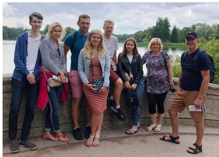
Tobiasu ģimenei patīk ceļot, paņemot līdzi arī draugus