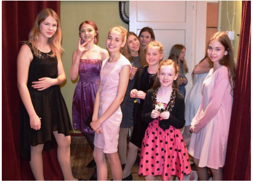
Konkursa dalībnieces. Lieliskas, uzņēmīgas un drosmīgas meitenes.

Ceļš uz sasniegumiem un pilnību nav viegls, tāpēc Supermeitenei 2019 vēl viens pārbaudījums – intervija.