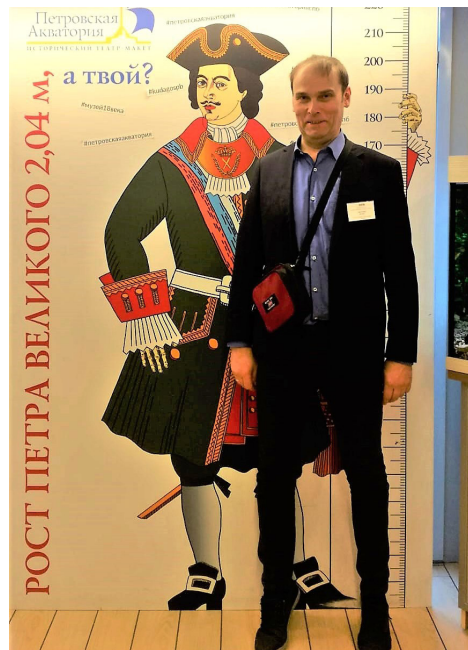
Kurš garāks? Nu, protams, ka Pēteris I, saukts arī par Pēteri Lielo, kura augums bija 2 metri un 4 centimetri. Pēterim I gan bijis garš augums, taču maza kāja - viņš valkājis 38.izmēra apavus.