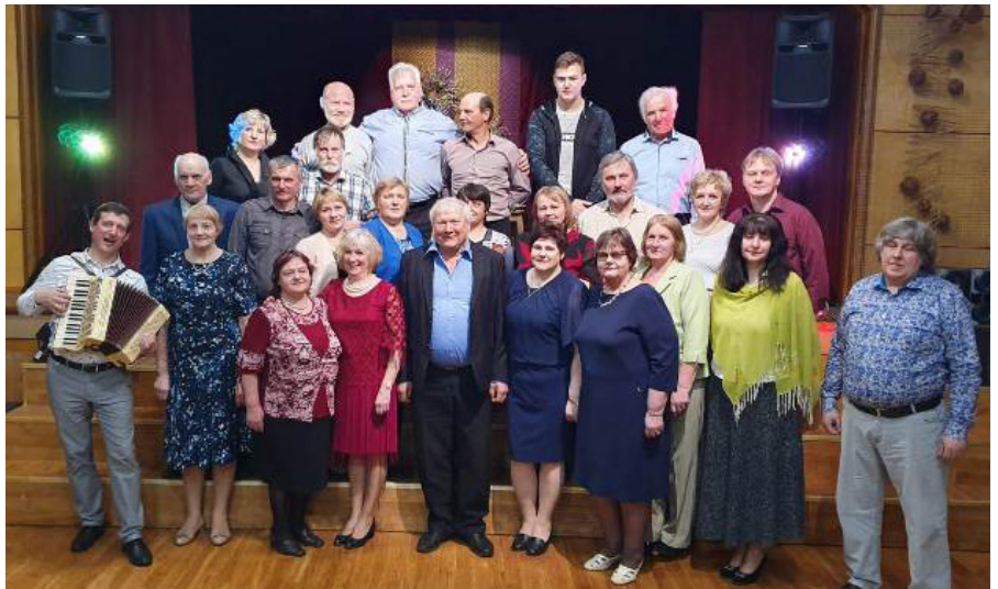
Šogad uz bijušo sovhoznieku balli bija sanācis maz cilvēku. Diezin vai būs arī trešā balle...

Bijušajiem darbabiedriem un paziņām sūtu siltus pavasarīgus sveicienus! Bet Ķeipenes ballē laikam tomēr nesatiksīties!