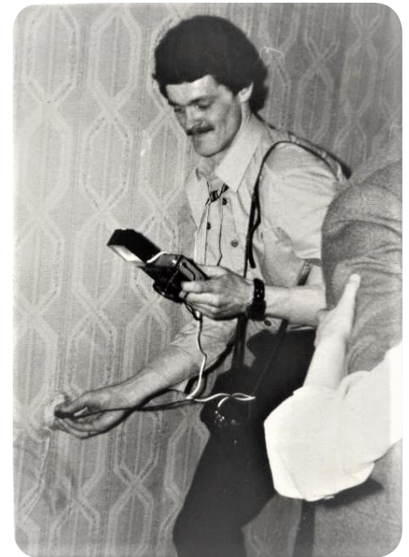
Vitauta aizraušanās no jaunības gadiem ir fotogrāfēšana

apnika gan braukāšana pa brīvdienām uz vienām un tām pašām vietām, gan arī deju vienveidīgums – visiem deju kolektīviem jāmacās un jādejo skates dejas.-