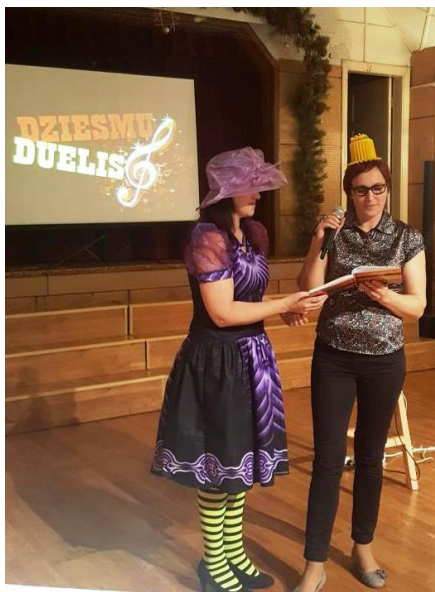
Mirkļis no Ķeipenes Dziesmu dueļa