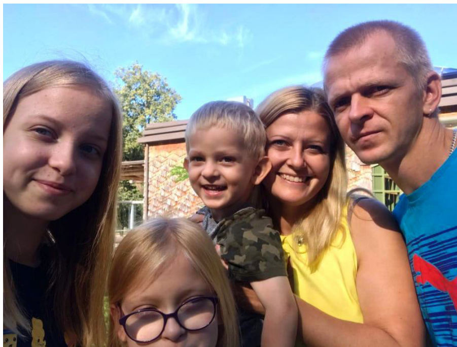
Markovsku ģimene.

- Jau no pirmās dienas, kad izlēmām dzīvot lauku mājā, mans un vīra kopējais lēmums bija, ka audzēsīm gaļas liellopus, nevis turēsīm slaucamās govīs. Šobrīd mums ir 10 liellopi, ko esam izlolojuši no maziem teliņiem, un nu jau