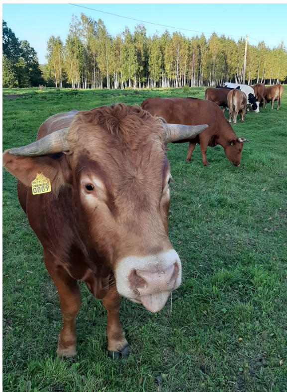
Dalbju ganāmpulks šajās septembra dienās

Un vēl. Nodzīvojusi Dalbjos jau vairākus gadus, varu droši apgalvot, ka lauki ir visfantastiskākā vieta, kur veidot savu ģimenes ligzdināju.