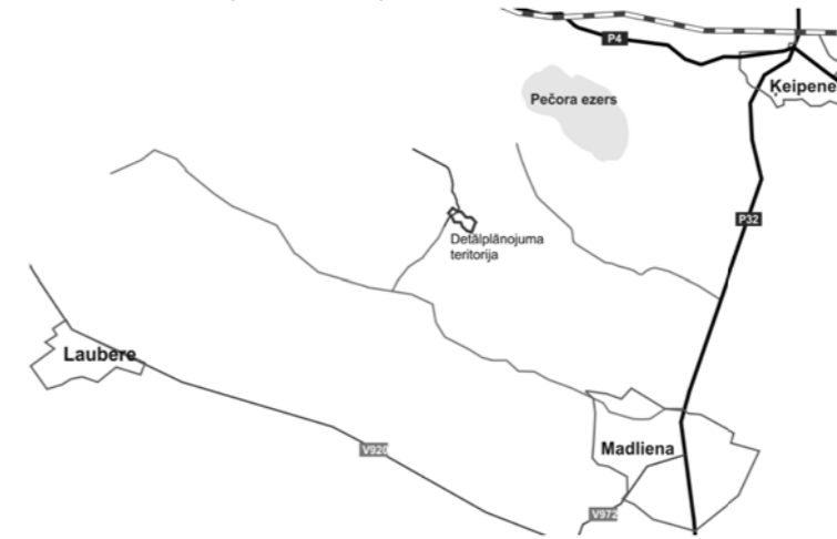
Objekta izvietojuma shēma