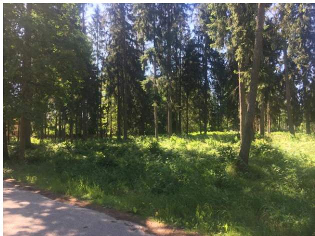
4.attēls. Detālplānojuma teritorija pie Suntažu ielas.