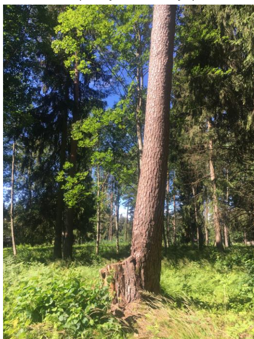
6.attēls. Detālplānojuma teritorijas centrālajā daļā esošais dižkoks (koord.LKS-92 x:537980; y:297134).