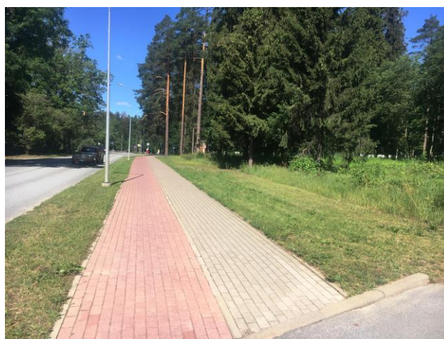
8.attēls. Detālplānojuma teritorija pie Brīvības ielas.