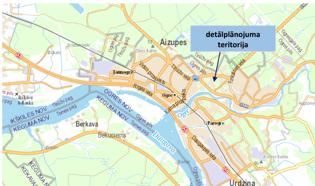
1.attēls. Detālplānojuma teritorijas novietojums.

Detālplānojuma teritorija atrodas Ogres novada, Ogres pilsētā savrupmāju apbūves kvartālā starp Brīvības ielu, Suntažu ielu un Norupes ielu. Detālplānojuma teritoriju 19745m 2 platībā veido divas zemes vienības: