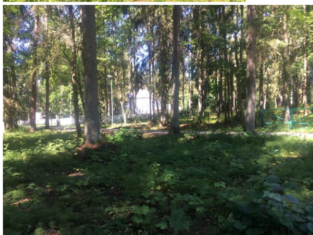
7.attēls. Detālplānojuma teritorija.