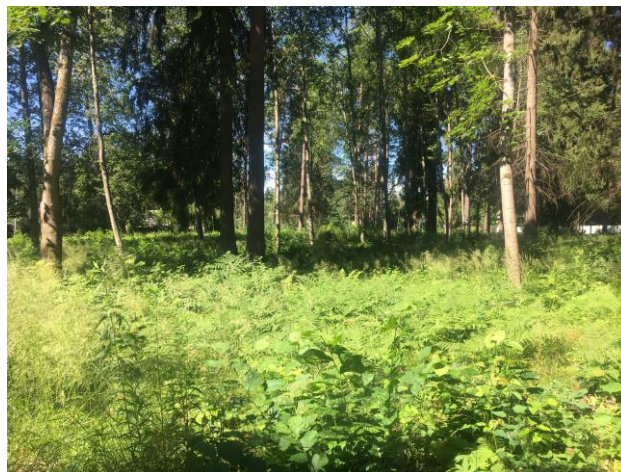
5.attēls. Detālplānojuma teritorija.