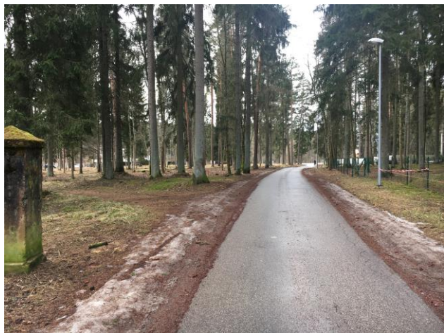
2.attēls. Detālplānojuma teritorija pie Norupes ielas.

Detālplānojuma teritorijā sastopami 2 aizsargājami koki (dižkoki) – parastās priedes Pinus sylvestris , kuru apjomi sasniedz 2010.16.03. Ministru kabineta noteikumu Nr.264 „Aizsargājamo dabas teritoriju vispārējie aizsardzības un izmantošanas noteikumi” noteiktos parametrus stumbra apkārtmēram 1,3 m augstumā no sakņu kakala parastai priedei – 2.5m. Datu informācijas sistēmā „Ozols” norādīts, ka priedes (koord.LKS-92 x:537980; y:297134) apkārtmērs 1,3 m augstumā no sakņu ir 2,58m. Atbilstoši Atzinuma „ dižkokam bijuši divi stumbri, viens no stumbriem šobrīd nozāģēts. Izvērtējama saglabātā priedes stumbra bīstamība ”. Otrs dižkoks atrodas Brīvības ielas malā. (koord.LKS-92 x:537899; y:297115). Stumbra apkārtmērs 1.3m augstumā nosakņu kakla ir 2,58m.