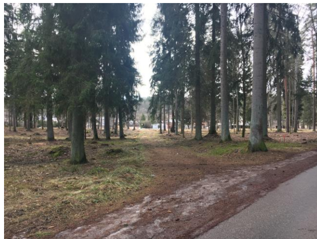
3.attēls Dabā esošā taka, kas nosacīti veido zemesgabalu robežu starp zemes vienībām Brīvības iela 55 un Suntažu iela 9.