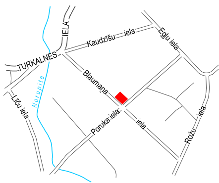
LOKĀLPLĀNOJUMA TERITORIJAS ATRAŠANĀS VIETA