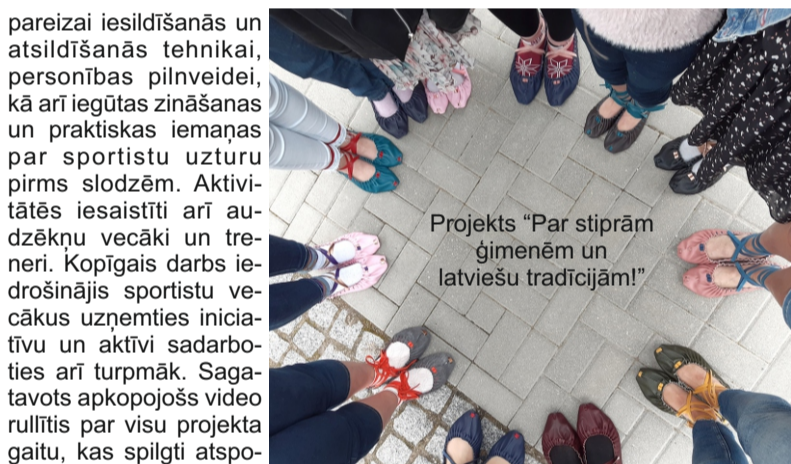
Projekts “Par stiprām ģimenēm un latviešu tradīcijām!”

pareizai iesildīšanās un atsildīšanās tehnikai, personības pilnveidei, kā arī iegūtas zināšanas un praktiskas iemaņas par sportistu uzturu pirms slodzēm. Aktivitātēs iesaistīti arī audzēkņu vecāki un treneri. Kopīgais darbs iedrošinājis sportistu vecākus uzņemties iniciatīvu un aktīvi sadarboties arī turpmāk. Sagatavots apkopojošs video rullītis par visu projekta gaitu, kas spilgti atspoguļo arī pozitīvas emocijas.