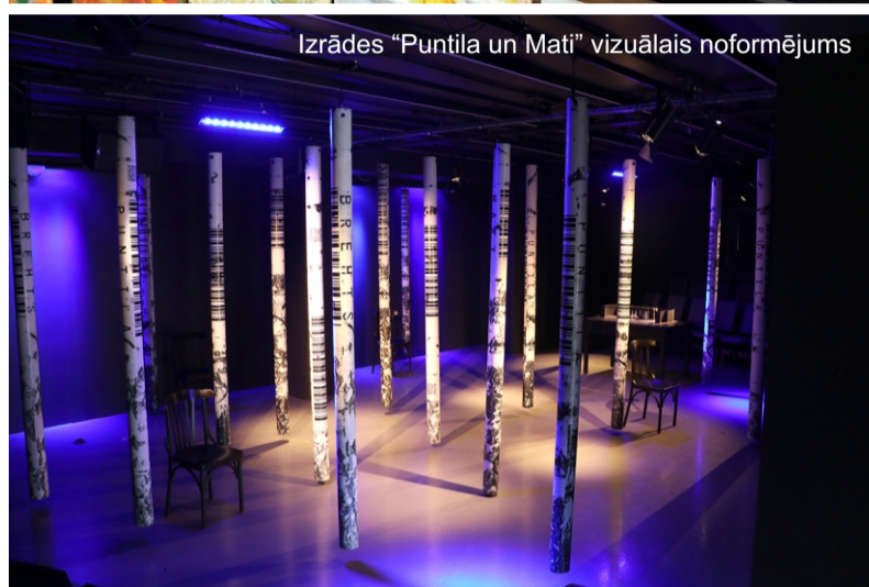
Izrādes “Puntila un Mati” vizuālais noformējums