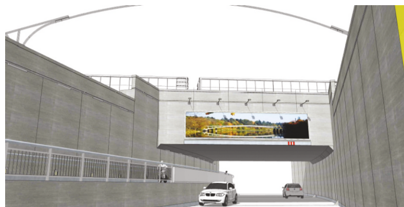
Autotransporta tunela zem dzelzceļa Kalna prospektā vizualizācija

Projekts tiek īstenots ERAF līdzfinansētā 5.1.1. specifiskā atbalsta