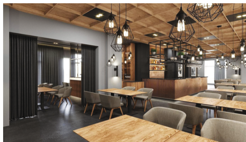
Šādi izskatīsies kafējnīca "Pie zelta liepas"

mērķa "Novērst plūdu un krasta erozijas risku apdraudējumu pilsētu teritorijās" ietvaros. 2018. gadā Ogres novada pašvaldība ir veikusi šādas aktivitātes: vecā dambja pārbūve posmā no nekustamā īpašuma Brīvības ielā 60 līdz īpašumam Brīvības ielā 80, Ogrē; priekšlikumu izstrādi aizsargmola (straumvirzes) pie Ogres upes ietekas Daugavā būvprojektam. 2019. gadā būvprojekts tiks iesniegts apstiprināšanai būvvaldē un uzsākti būvdarbi. Pie labvēlīgiem apstākļiem būvdarbi šogad tiks arī pabeigti. Jauna aizsargmola būvniecība izmaksās 3 927 618 EUR, 85% no tiem, kā arī neattiecināmās izmaksas sedz ERAF.