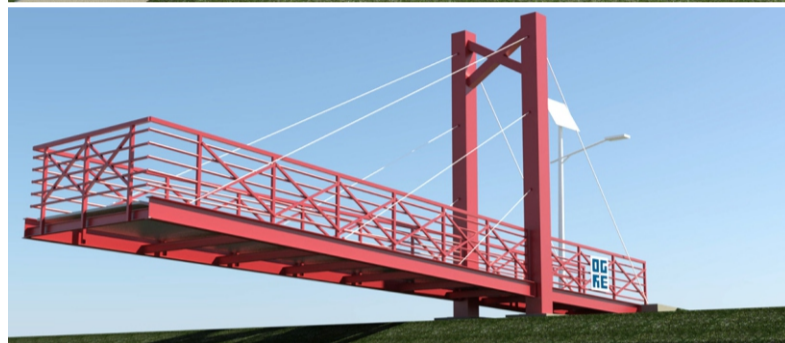
Trošu tilts un skatu platforma Meņģelē