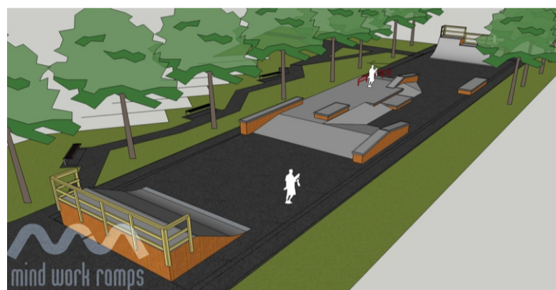
Skeitparka Ogres stadionā vizualizācija