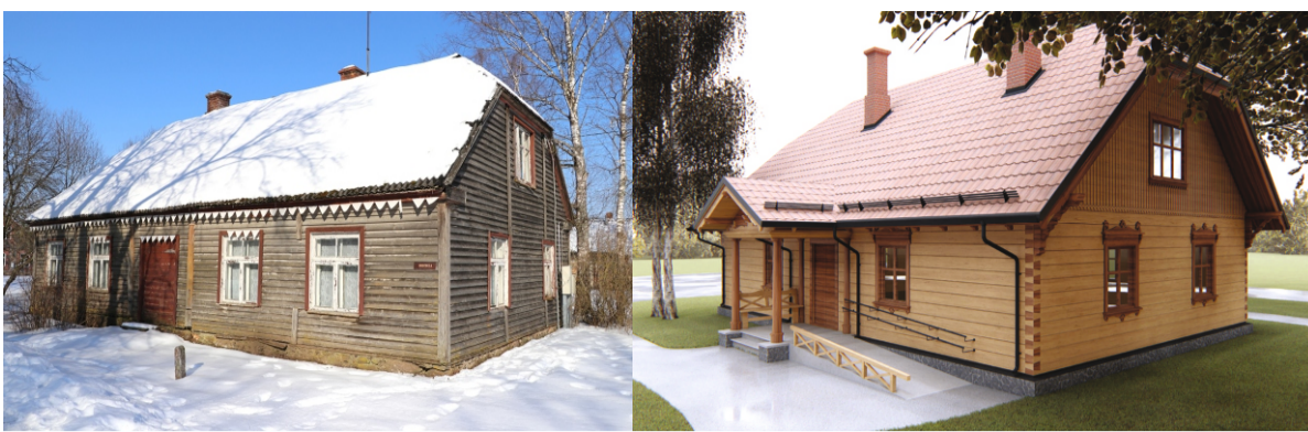
"Krievskola" tagad un pēc pārbūves

Projekta mērķis – atjaunot sanatorijas Gaismas prospektā 2/6, Ogrē, jumtu un Anša Cīruļa sienu gleznojumus, kā arī iekārtot telpas radošajām nodarbībām. 2019. gadā projekta īstenošanai paredzēti 792 428 EUR, no tiem 246 500 EUR ir ERAF līdzfinansējums.