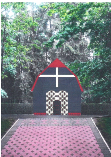
Jaunā Aderkašu kapliča