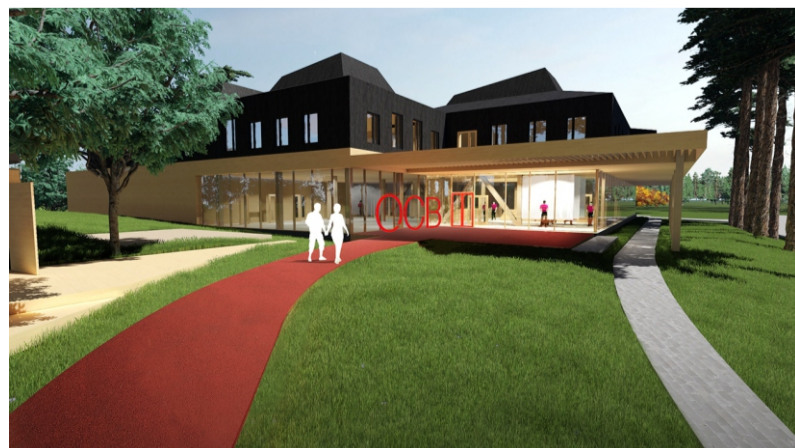
Ogres Centrālās bibliotēkas jaunā ēka