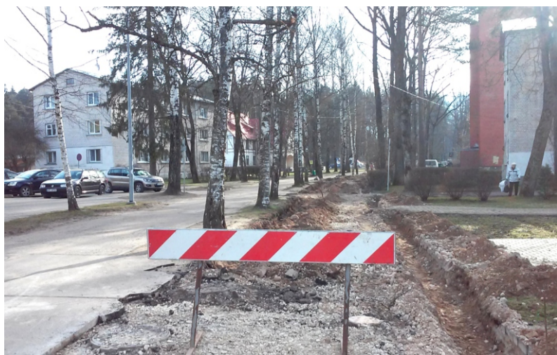
Jau maijā līdz gājēju tiltam pār Ogres upi varēs doties pa gludu Bērzu alejas segumu

Pavasaris ir klāt, laika apstākļi gana piemēroti ielu un ceļu pārbūvei un remontam, kā arī citiem ārā veicamiem darbiem.