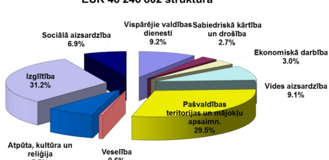
Ogres novada pašvaldības 2015. gada pamatbudžeta izdevumu EUR 48 246 802 struktūra

Projektā "Sporta inventāra iegāde Ogres vispārējās izglītības iestādēm" atvēlēti EUR 6 000 un vasaras nometņu organizēšanai Suntažos – EUR 4 635. Ogres Valsts ģimnāzija realizē projektu "Fiziskās audzināšanas loma skolēnu veselības stiprināšanā", finansējums EUR 15 940, savukārt Ogres sākumskolas projekta "Vides izglītības dienas nometne "3 D – domājošs dabas draugs" līdzfinansēšanai – EUR 1968.