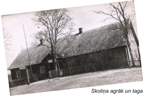
Skoliņa agrāk un tagad

Tāpēc pārliecināti apgalvot, ka rakstos minētais fakts, ka 1779. gadā Ķeipenes Ķīlēnos atvērta muižas skola zemnieku bērniem ir pirmā skola mūsu pagastā, nevar, jo nezinām, vai Ķīlēni atradās mūsu pagasta pašreizējā teritorijā. Ēkas, par kurām sakām: "Reiz te bija skola..."