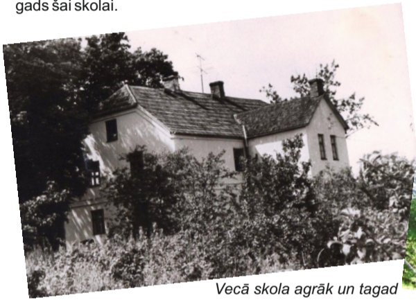
Vecā skola agrāk un tagad

šajā ēkā ar nelieliem pārtraukumiem atradusies līdz 2. Pasaules kara beigām. 1943./1944. g. ir bijis beidzamais mācību gads šai skolai.