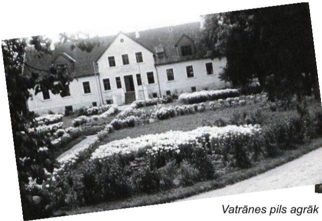
Vatrānes pils agrāk un tagad

Vecā skola tagad – daudzdzīvokļu dzīvojamā māja. Iesākumā Vecās skolas atrašanās vietā 1863. gadā uzcelta koka skolas ēka, kura ap 1877. – 1879. gadu nojaukta. Jauna divstāvēģa mūra skolas ēka tapusi 1880. gadā. Gan koka skolas ēkā, gan mūra ēkā atradās Ķeipenes I pakāpes pamatskola . Kad pamatskolu likvidēja (tas varētu būt pag. gs. 20. gadu beigās – 30. gadu sākums), ēkā darbojās nespējnieku patversme, bet Ķeipenes skolasbērni turpināja mācības Ķeipenes pagasta Madlienas 6-gadīgajā pamatskolā, kas tagad atrastos Madlienas pagasta teritorijā. No 1945. gada līdz 1974. gada vasarai ēkā atkal ir skola – Ķeipenes 7 gadīgā skola, no pag. gs. 60. gadu sākuma – Ķeipenes 8 gadīgā skola.