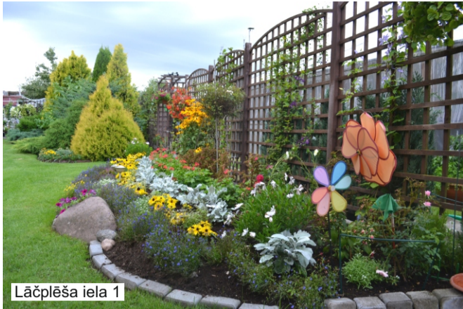
Lāčplēša iela 1