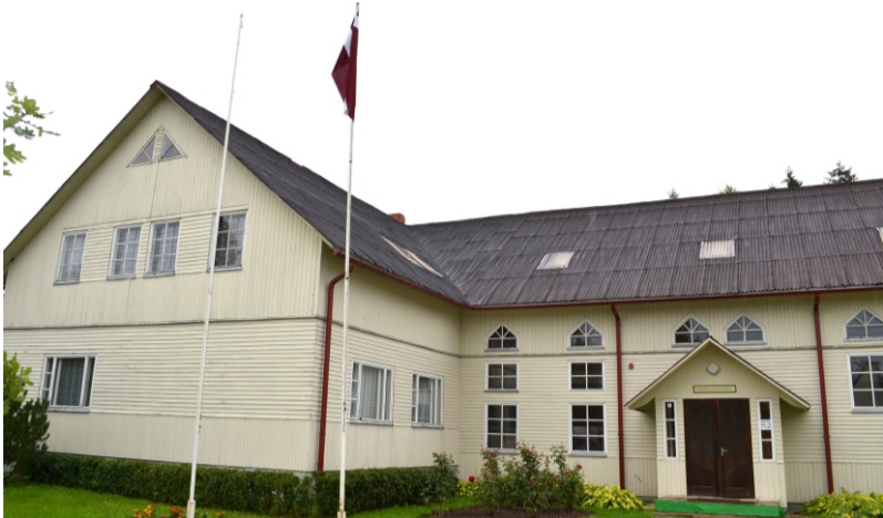
Arī jaunajai skolas ēkai šogad jubileja – pirmie 15 gadi

Šogad Mazozolu izglītības iestādei aprit ļoti cienījama jubileja – 140 gadi. Oktobrī plānots organizēt absolventu, pedagogu un tehnisko darbinieku salidojumu.