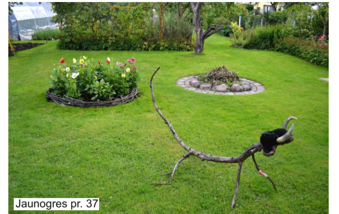
Jaunogres pr. 37