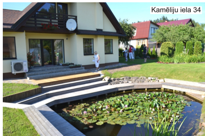
Kamēliju iela 34