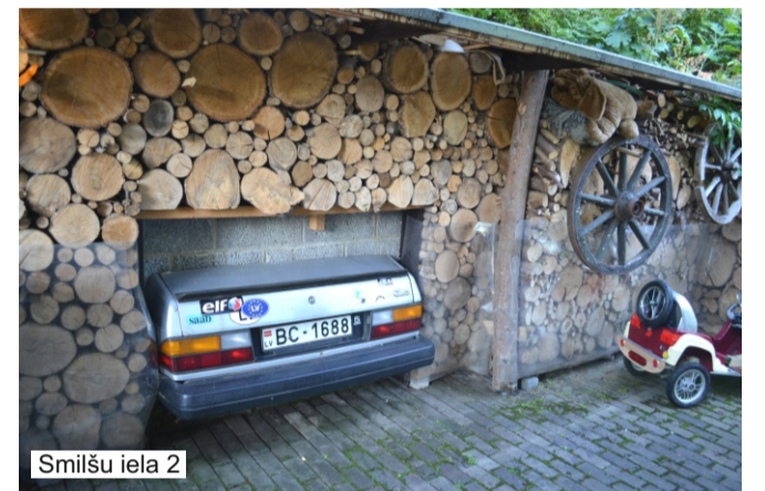
Smilšu iela 2