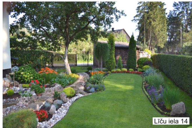
Līču iela 14