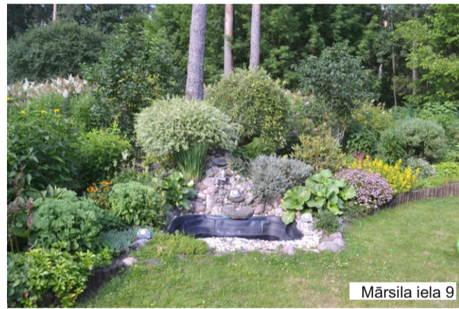
Mārsila iela 9