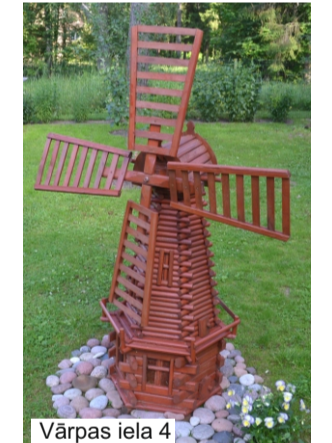
Vārpas iela 4