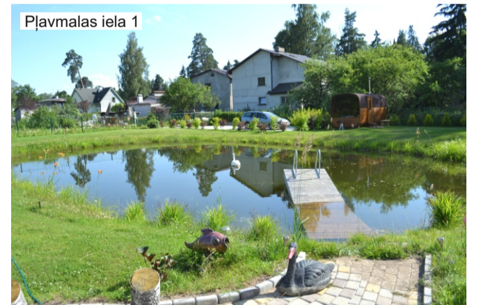
Plavmalas iela 1