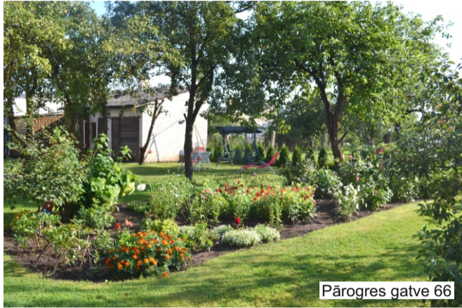
Pārogres gatve 66