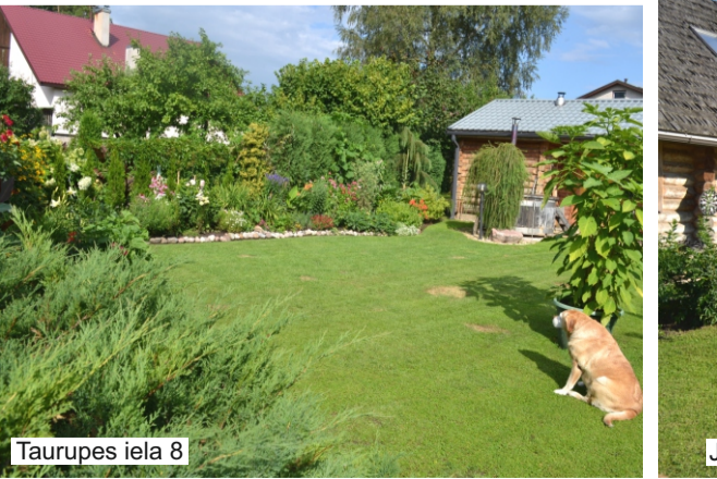
Taurupes iela 8