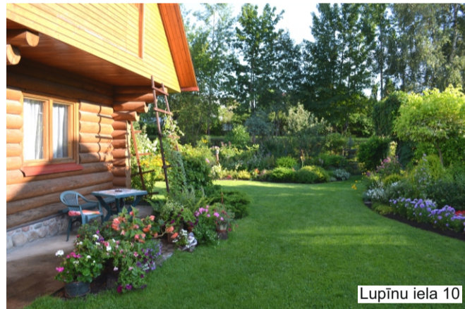
Lupīnu iela 10