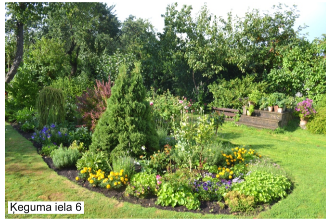
Ķeguma iela 6