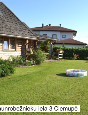
Jaunrobežnieku iela 3 Ciemupē