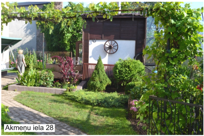
Akmeņu iela 28