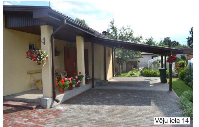
Vēju iela 14