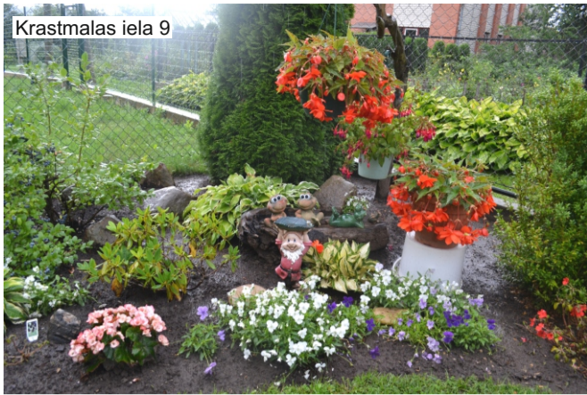
Krastmalas iela 9