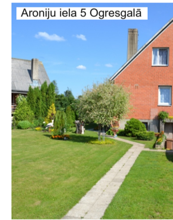
Aroniju iela 5 Ogresgalā