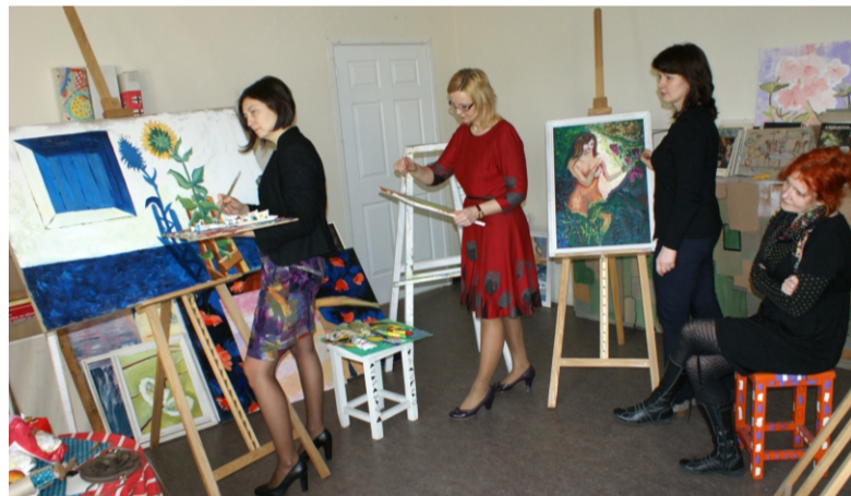
Skolotāji gatavojas izstādei "Paradīze ir šeit" – izstāde apskatāma izstāžu zālē skolas mansardā