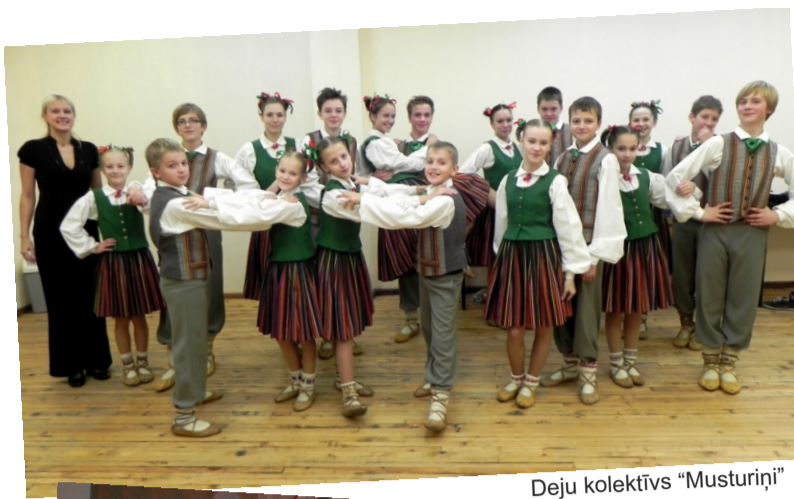
Deju kolektīvs "Musturiņi"