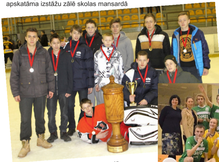
"Placēna kausa" ieguvēji 2014.gadā