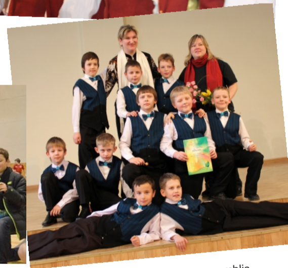
Zēnu vokālais ansamblis