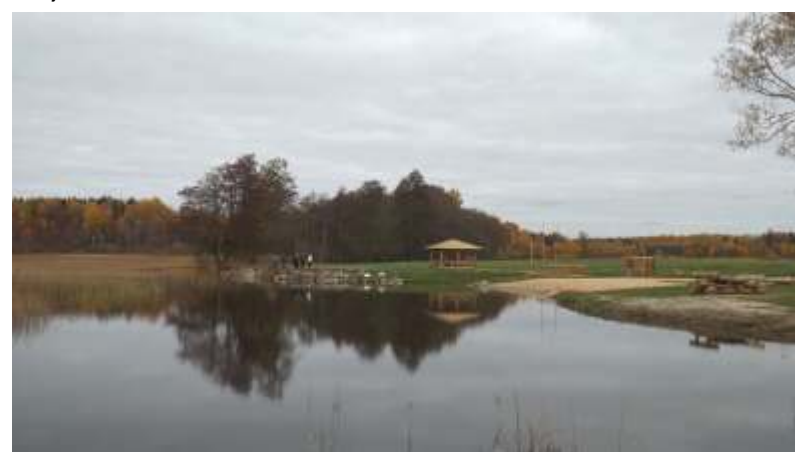
Plaužezera krast ir izveidota jauka atp tas vieta

• iedz vot ju grupa "Madlienas iniciat vas grupa" ir ier kojusi atp tas un ugunsкура vietu Madlienas kult ras nama skv r , kur pulc ties uz daž diempas kumiem.