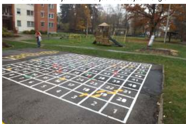
Jauns rotaļu aprīkojums Bērzu alejās 8 un 8a pagalmā