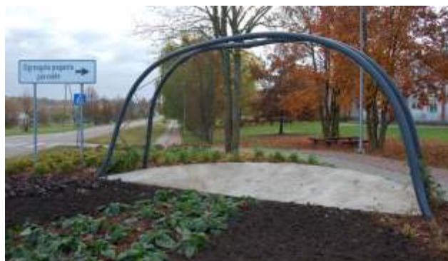
Ogresgalā pagasta centrā jauna vizītkarte