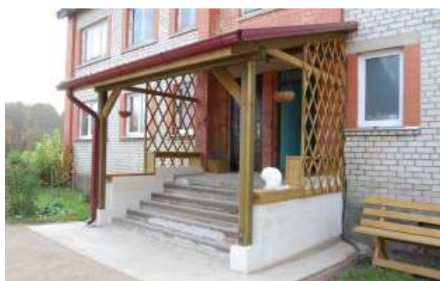
Mazozolos mājas "Brakī" atjaunots ieejas mezgls