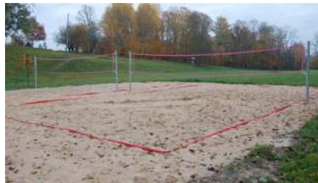
Ogresgalā jaunieši ierīkoja pludmales volejbola laukumu