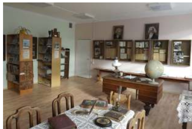
Sudrabu Edžus muzeja mājvietā tagad ir bijušā Meleles bērnu dzimšanas telpa