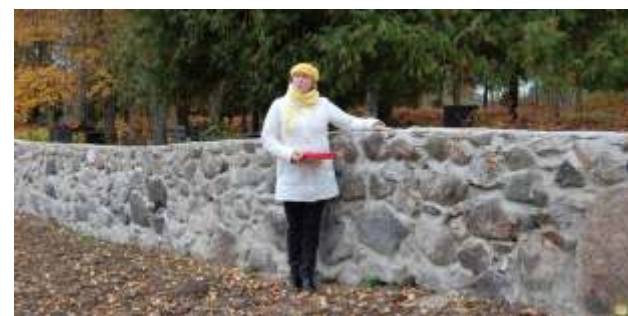
Suntažos atjaunots kapsētā ieejas mērķis