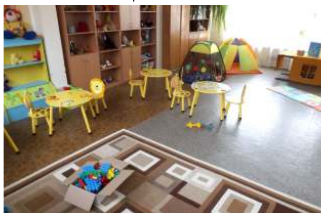
Mazozolos jauns aprīkojums bērnu rotaļu telpā