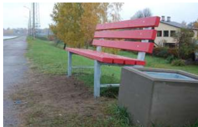
Ogrē, Dambja ielā uzstādīti jauni soliņi un atkritumu tvertnes