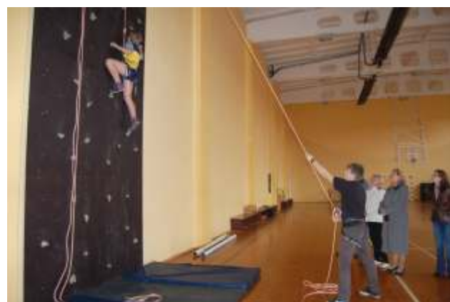
Ogresgalā izveidota klinšu kāpšanas siena

Nākamais laikraksta numurs – novembra 1. diena