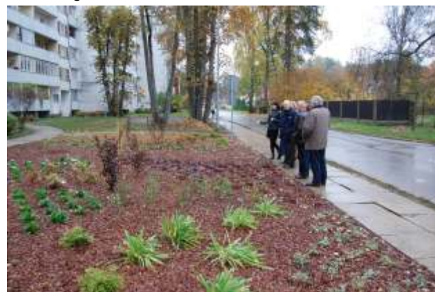
Ogrē, Lapu ielā 6 jauni apstādījumi