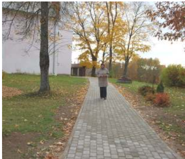
Jauns celiņš pie Madlienas baznīcas