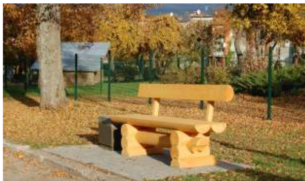
Madlienas centrā uzstādīti jauni soliņi