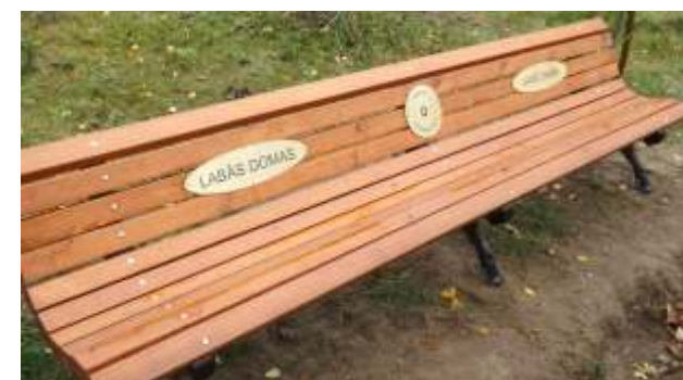
Lazdukalnā parkā Ogres rotarietis darītais soliņš