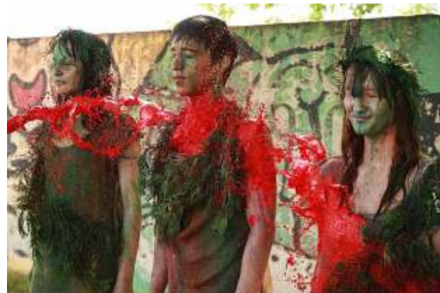
Ogres Interaktīvais klubs iekārtoja stadiona sienu