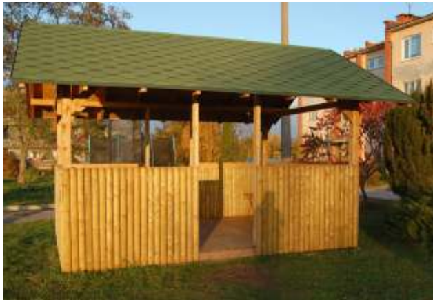
Krāpstarps starp daudzdzīvokļu mājām tapusi nojume