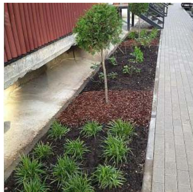
Ogrē, Mākalnes prospektā 9 atjaunots gājēju celiņš un veikti apzaļošanas darbi