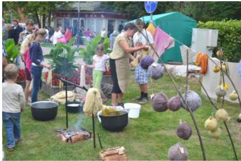
Meistardarbn cas dzijas kr sošan pils tas sv tkos 2012. gada august .

Pašlaik kult ras darbinieku galven r pe ir saist ta ar gatavošanos Dziesmu un Deju sv tkiem, kas notiks j lij R g un kuros kupl skait piedal sies ar Ogres novada dzied t ji un dejoj ti.