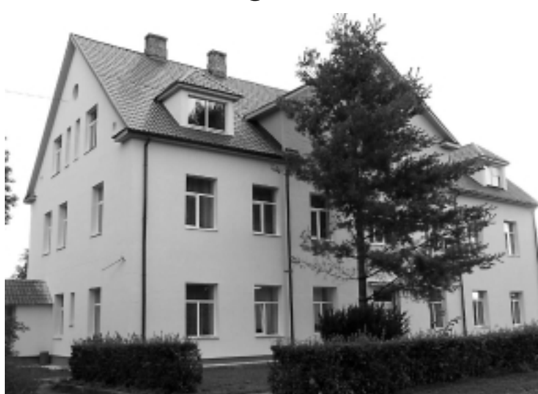
Meņģeles pamatskolas ēka pēc renovācijas izskatās gluži kā jauna.

Arī profesionālās ievirzes un interešu izglītības iestādēm tiek samazināts finansējums. Šobrīd mūzikas un mākslas skolas finansē Kultūras ministrija. V. Pūķe: “Ir pieņemti Ministru kabineta noteikumi, kas paredz, ka 2014. gadā izmaksas par programmas realizā-