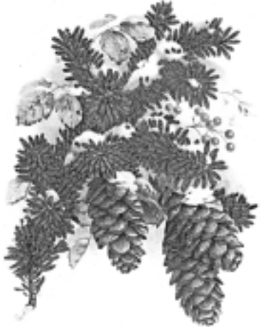
Priekšgais Ziemassvētku noskaņās

Daudzi ogrēnieši un pilsētas viesi, apmeklējot Ogres Vēstures un mākslas muzeju, jau ir paguvuši izbaudīt izstādes "Nāk Svētvakars" radīto īpašo Ziemassvētku gaidīšanas laika noskaņu.