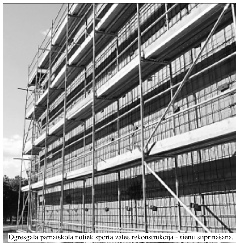
Ogresgala pamatskolā notiek sporta zāles rekonstrukcija - sienu stiprināšana.

notiks aktu zāles gaitenā remonts. Kosmētiskais remonts tiks veikts klasēs – paredzēts krāsot grīdu, mainīt grīdas segumu, veikt remontu tualetu telpās un gaitenos. 1. klasēm pēc iespējam tiks mainīti krēslī un galdī, kā arī mainītas virsmas divvietīgiem galdiem (līdz 4. klasēm). Līdz rudenim visiem pedagogiem būs ierīkoti datorgaldī un darba galdī. V. Bauska