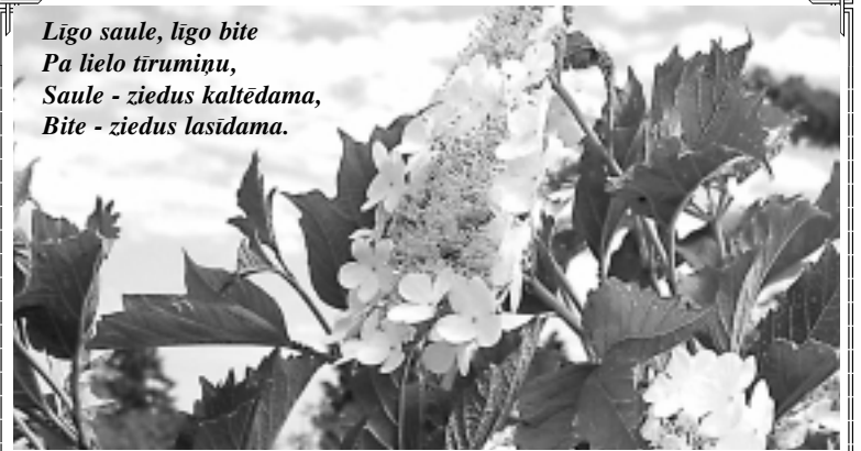
Ligo saule, ligo bite Pa lielo tīrumiņu, Saule - ziedus kaltēdama, Bite - ziedus lasīdama.

Lai jūsu Ligo vakars ir gaismas, prieka un dziesmu pielietis! Lai gada garākajā dienā visapkārt smaržo Jaņu zāles! Lai ugunskuru gaismīņa jūsu mājās ienes svētību, saticību un mieru! Priecīgu ligošanu!