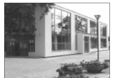
Ogres autoosta Ogrē, Brīvības ielā 12a. Tālrunis 5024492.