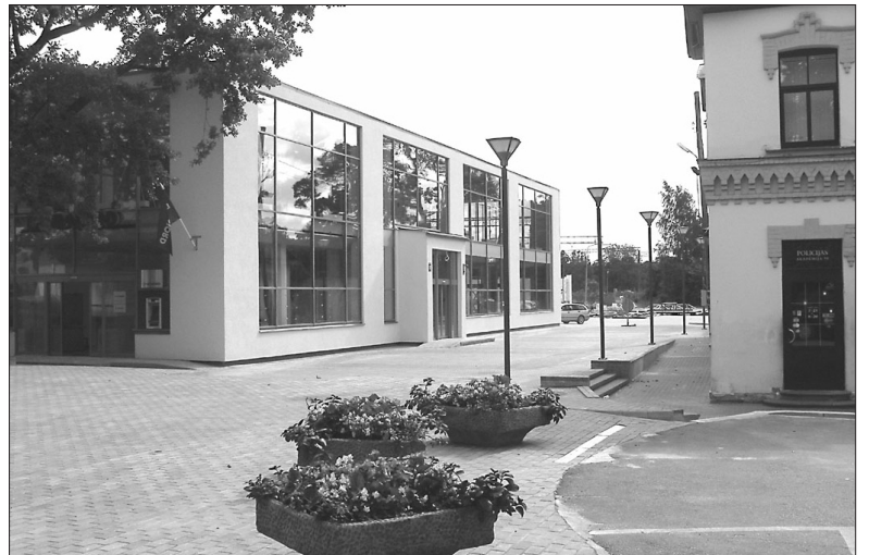
SIA "L.L.K." informē, ka 14. septembrī paredzēts atklāt jaunuzcelto autoostu Ogrē, Brīvības ielā 12 a. Atklāšanas pasākums notiks pl. 16.