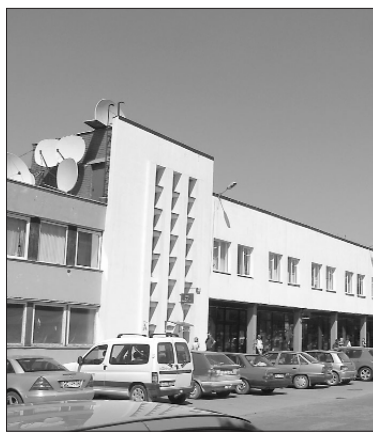
Pašvaldības aģentūras izveidošanas mērķis

Ogres novada pašvaldības aģentūra "Mālkalne" tika izveidota, lai īstenotu vienotu Ogres novada domes politiku siltumapgādes, ūdensapgādes, notekūdeņu novadīšanā un Ogres novada nekustamā īpašuma apsaimniekošanā.