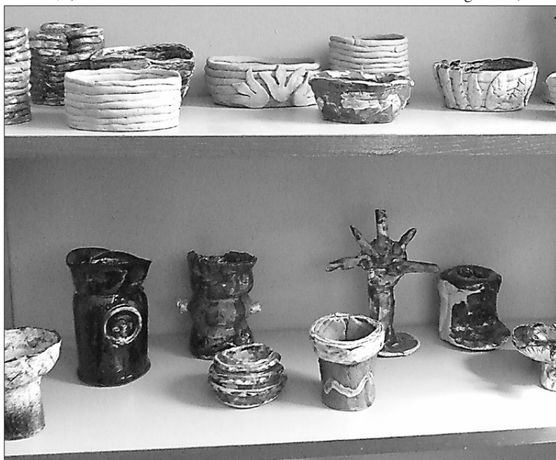
Dienas centra “Saime” klientu rokdarbi.