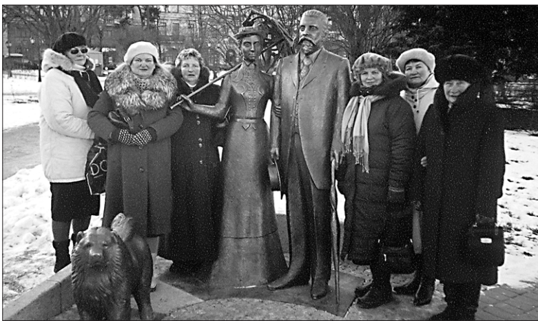
Attēlā – klubiņa dalībnieki pie Rīgas mēra Armidsteda pieminekļa operas skvērā.

Decembra mēnesī vienu svecīti savā gada jubilejas tortē varēja iedegt Ciemupes bibliotēkas lasītāju klubiņš "Dalies priekā". Tortes nebija, bet dziedāšana un dancošana gan, jo pie mums viesojās folkloras grupa "Artava". Šis nīprās sievas mums garlaikoties nelāva!