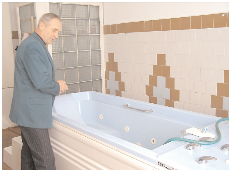
2006. gadā p/a “Dziednīca” ierīkota zemūdens masāžas un pērļu vanna.