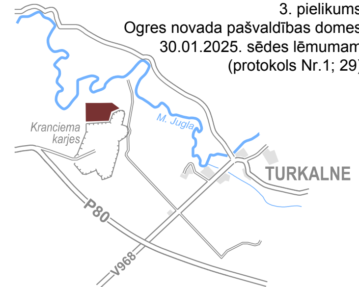
LOKĀLPLĀNOJUMA TERITORIJAS ATRAŠANĀS VIETA

3. pielikums Ogres novada pašvaldības domes 30.01.2025. sēdes lēmumam (protokols Nr.1; 29)