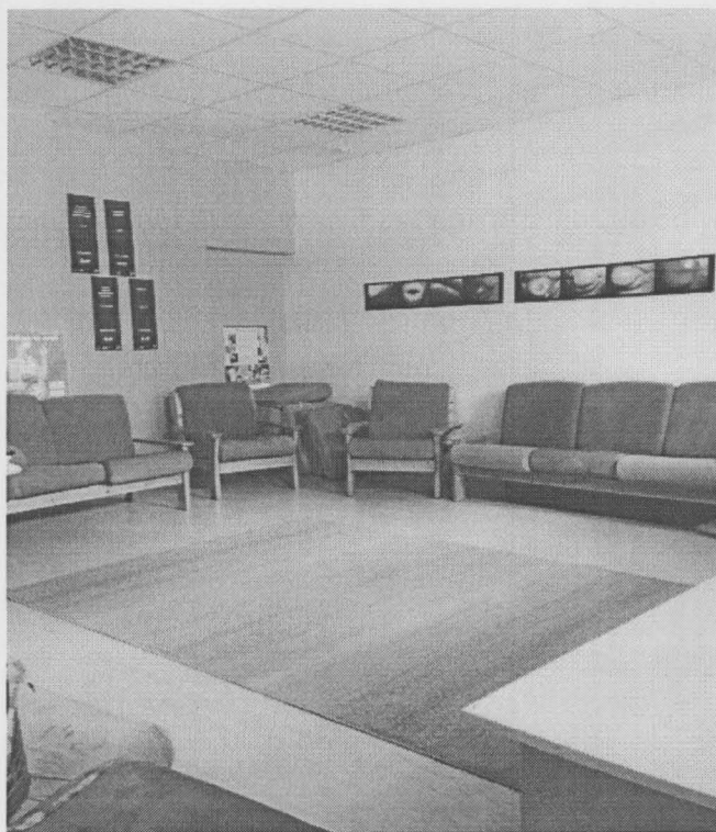
Meža pr. 9 (3 st. 64., 65.telpa)

PA "Dziednīca" reorganizētā Jaunatnes veselības centra telpas atrodas jau kopš 2004.gada. Telpas ir izveidotas un aprīkotas ar visu nepieciešamo, lai uzņemtu dalībniekus interaktīvām nodarbībām. Telpas lieliski kalpo arī citiem veselības veicināšanas pasākumiem, kursiem, semināriem, konsultācijām.