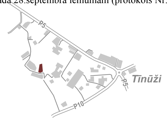
LOKĀLPLĀNOJUMA TERITORIJAS ATRĀŠANĀS VIETA