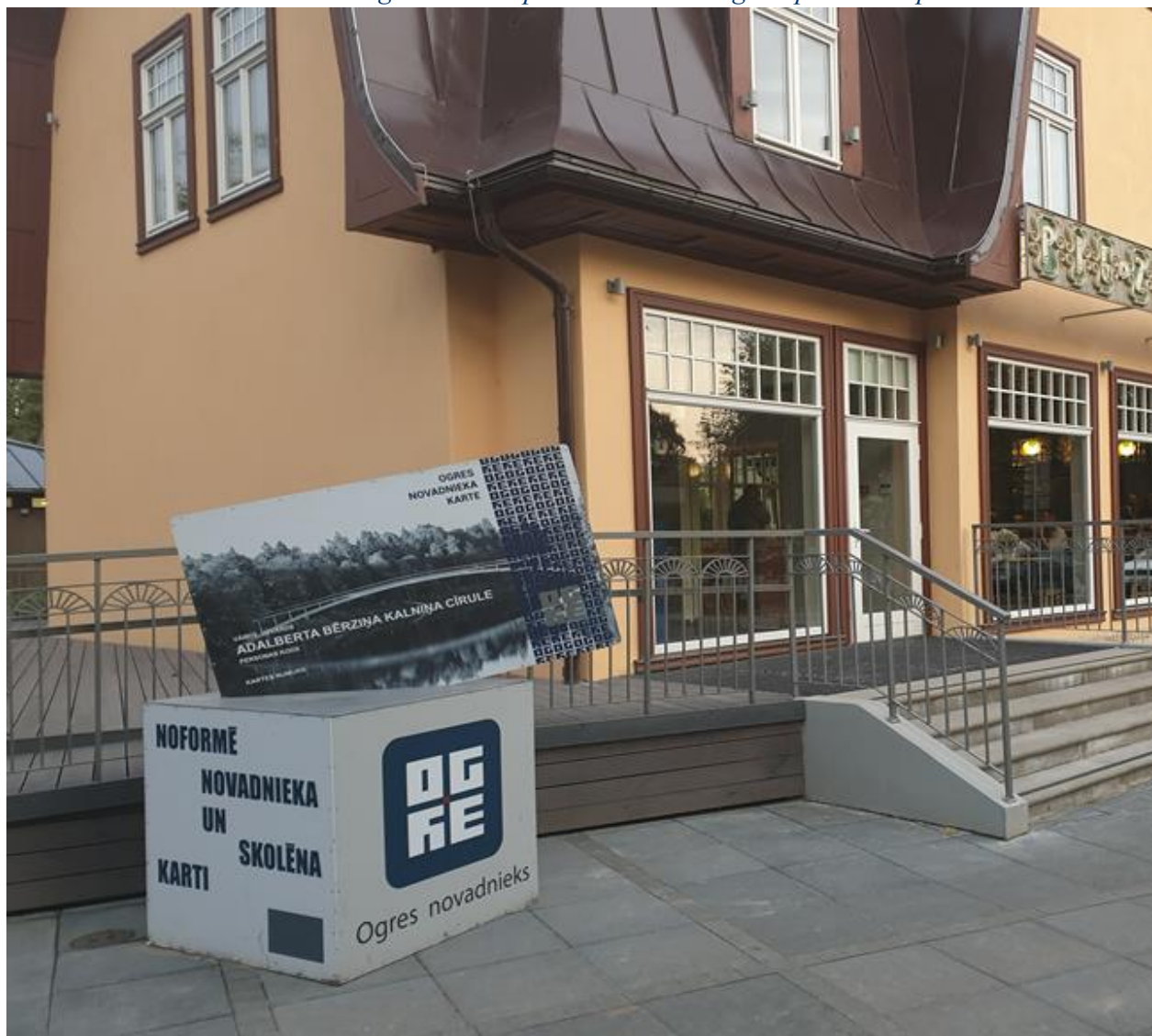
“Pie zelta liepas” Brīvības ielā 18, Ogrē

Pagājušajā gadā tika veikti Ogres novada Kultūras centra Lielās zāles atjaunošanas darbi, kā arī iegādāti un uzstādīti 703 jauni krēsli ar paceļamiem sēdekļiem un roku balstiem un 30 paliktņi bērnu sēdvietām. Ņemot vērā Lielās zāles noslodzi, tās renovācija bija ļoti nepieciešama.