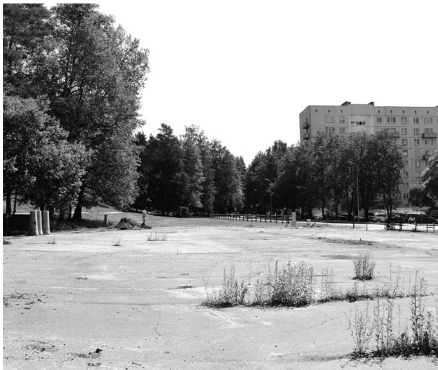
Stāvvietas Zilajos kalnos

Ogres novada pašvaldības dome 2019. gada 19. septembrī pieņēma lēmumu par nekustamā īpašuma Zilokalnu prospektā 13 Ogrē (platība 2600 m 2 ) pārņemšanu, lai izveidotu autostāvvietu dabas parka "Ogres Zilie kalni" apmeklētāju un pilsētas iedzīvotāju autotransporta novietošanai. Pamatojoties uz šo lēmumu, 2020. gada 16. aprīlī tika izdots Ministru kabineta rīkojums par šī valstij piederošā nekustamā īpašuma nodošanu bez atlīdzības Ogres novada pašvaldībai tās autonomo funkciju īstenošanai.