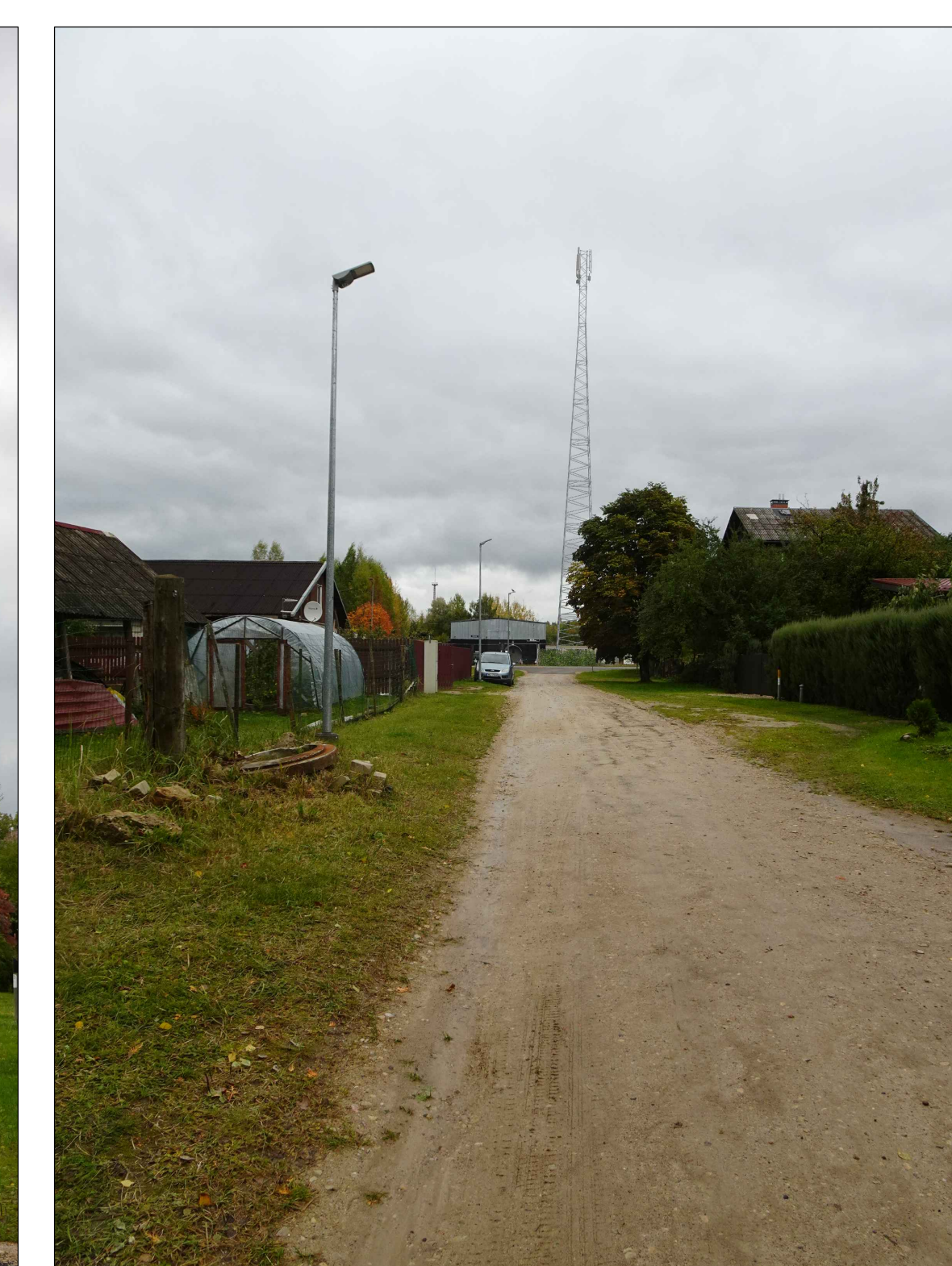
Skats no Ošu ielas