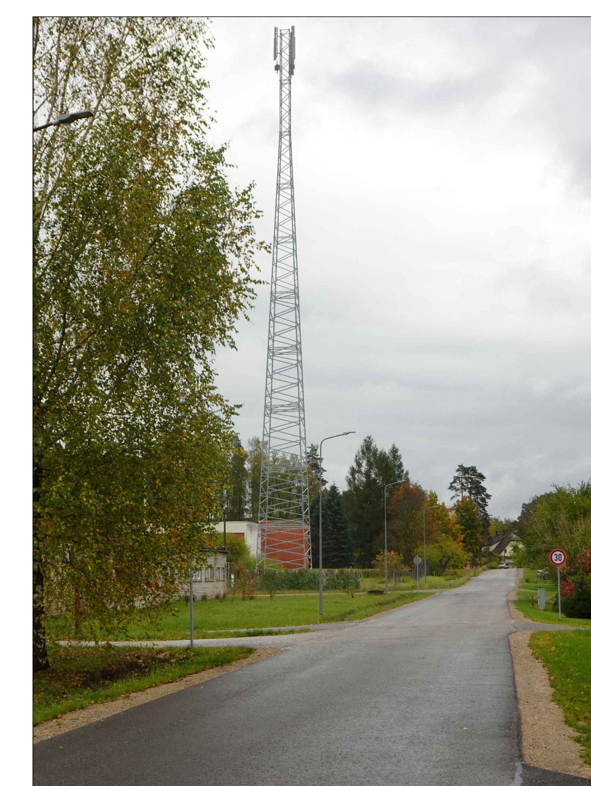
Skats no Stirnu ielas Ziemeļu daļas