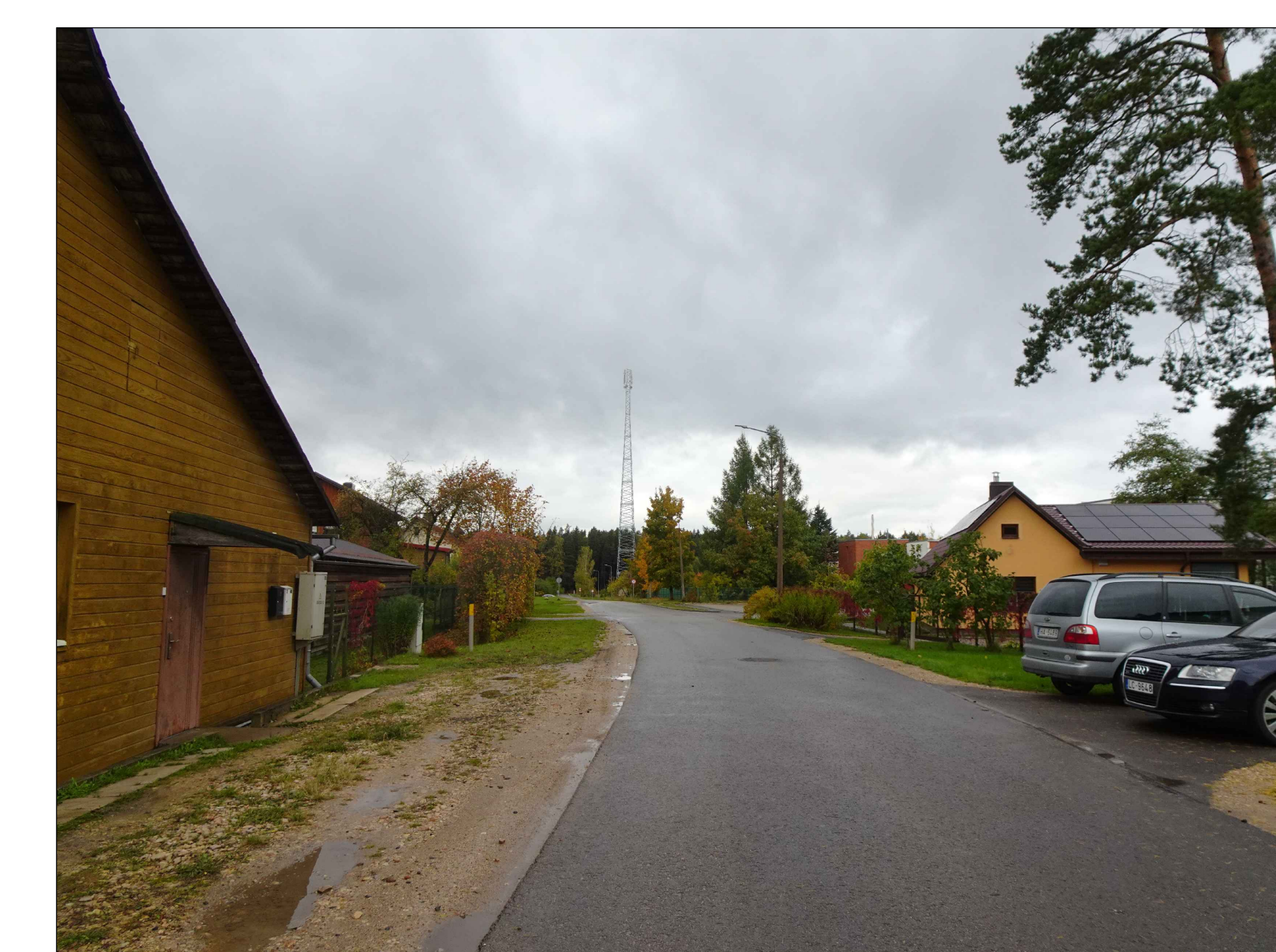
Skats no Stirnu ielas Dienvidu daļas