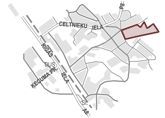
TERITORIJAS ATRAŠANĀS VIETA