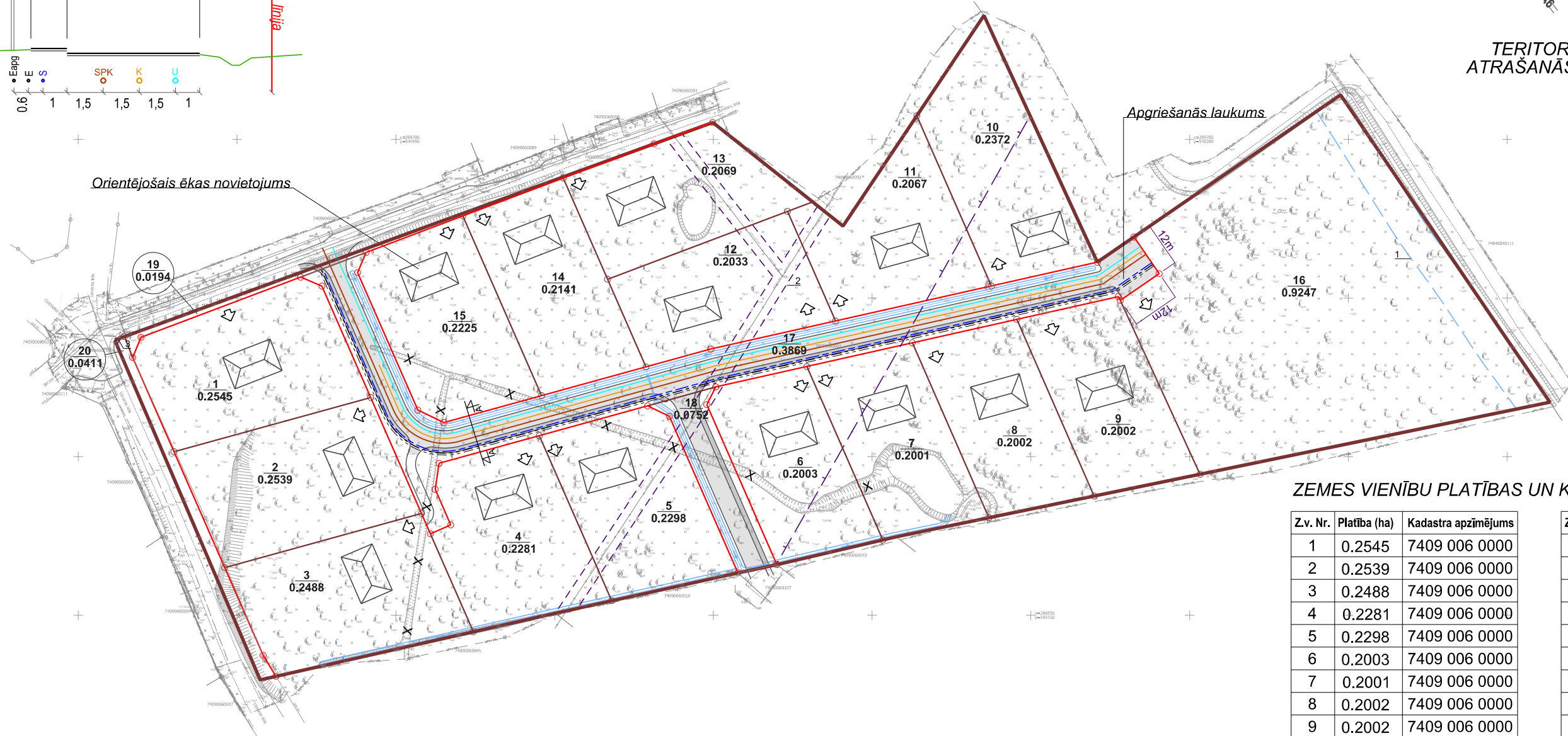
ZEMES VIENĪBU PLATĪBAS UN KADASTRA APZĪMĒJUMI