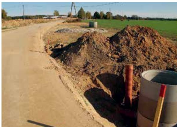
Autoceļš Nr. 19 "Jumprava - Rezgaļi - Kaktiņi".

Vasaras beigās tika uzsākts projekts "Grants ceļu pārbūve uzņēmējdarbības attīstībai Lielvārdes novadā". Šobrīd tas ir noslēdzies, un jau decembra sākumā trīs grants autoceļi nodoti ekspluatācijā.