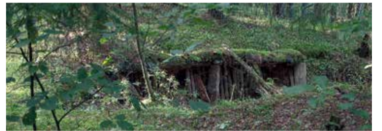
2. Pasaules kara laika pazemes bunkuri netālu no Lielvārdes teritorijas.

Rīgas plānošanas reģions, turpinot darbu pie projekta "Military Heritage", meklē cilvēkstāstus par notikumiem no Pirmā pasaules kara sākuma līdz pat padomju režīma noslēgumam, kas ietver cilvēku likteņus, ikdienas sadzīvi un pastāvēšanu dažādu varu krustcelēs. Tāpat aicinām atsaukties iedzīvotājus, kuru teritorijā atrodas vēl kāds neapzināts militārā mantojuma objekts ar tūrisma potenciālu.