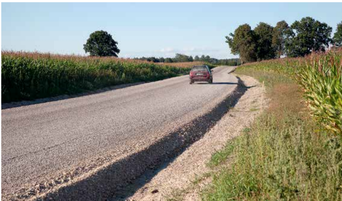
Autoceļš Lielvārde - Rozītes ar dubulto virsmas apstrādi.