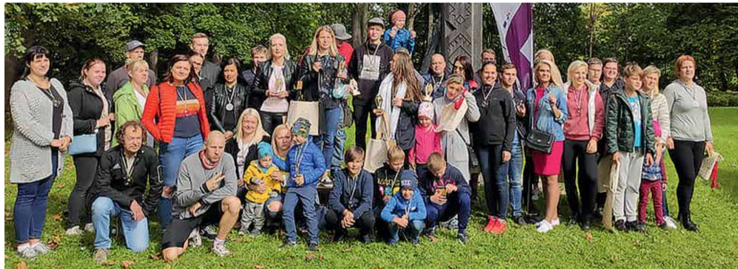
Kopbilde no apbalvošanas pasākuma 13. septembrī Lielvārdes parkā.