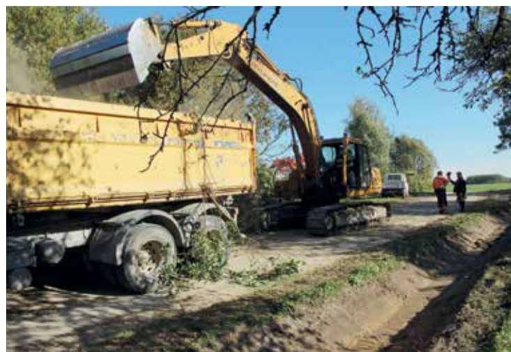
Autoceļš Lielvārde - Rozītes - Ozoli - Kraukļi.