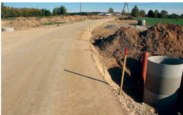
Autoceļš Ķedele - Elkšņi - Jumprava.

veikt remontdarbus par pašvaldības finansējumu.