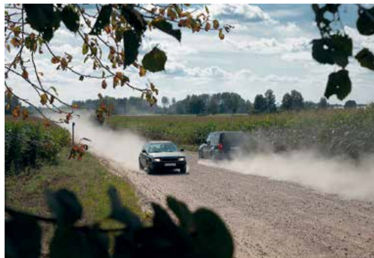
Autoceļš Lielvārde - Rozītes ar grants segumu.