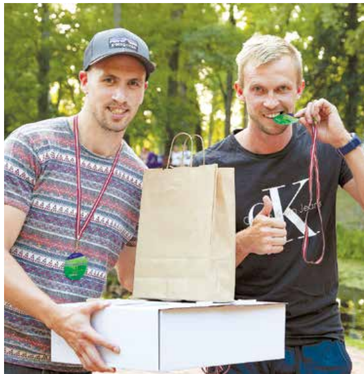
Uzvarētājkomandas "Visa Veida Kustība" pārstāvji apbalvošanas pasākumā.

Šogad čempionu laurus Lielajā aplī plūca komanda "Visa Veida Kustība" (noskrietu aptuveni 26 km, atrasti 51 no 52 objektiem), 2. vietā komanda "Saulesbērni"