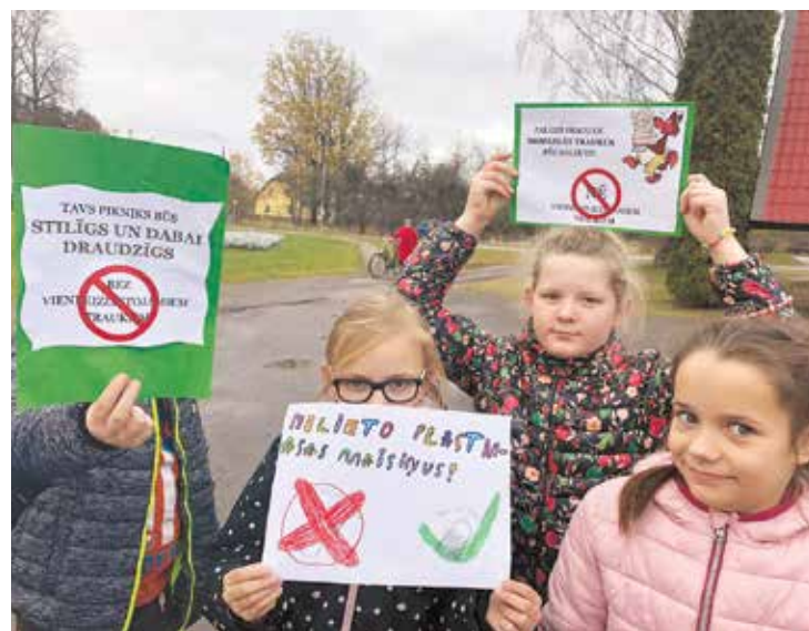
Pulciņa dalībnieki piedalījās akcijā "Nē vienreizlietojamai plastmasai" un ar paštaisītiem plakātiem devās pa Jumpravas pagasta ielām, kur aptaujāja iedzīvotājus, vai iepērkoties izmanto plastmasas vai auduma maisiņus.

"Bērniem ir svarīgi apmeklēt interesešu izglītības pulciņus, jo tie palīdz attīstīt noteiktas prasmes, veicina talantu izkopšanu un reizēm tur rodas pirmās profesionālās iemaņas, kas var noderēt karjeras plānošanā. Katru gadu augus-