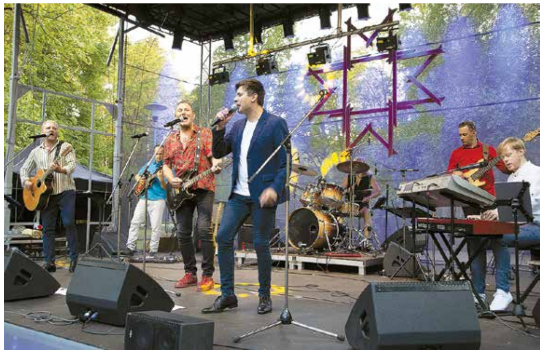
Svētku koncerts uz Spīdaldas saliņas.

Viena no Rīta zvaigznes būtiskākajām ietekmēm esot spēja mainīties, kas ir pamats jebkurai attīstībai. Ņemot vērā viedokli par iepriekšējo gadu svētku norisi, šogad darba grupa, cenšoties saglabāt jau iecienītās lietas, mēģināja nedaudz mainīt ierasto – sporta aktivitātes piedāvājām sestdienas rītā, atklāšanas pasākumu pie muzeja veidojām ar "Meistaru dārza" un gaismas virteņu radīto noskaņu, atteicāmies no gājiena, kas dažādu iemeslu dēļ līdz galam sevi neattaisnoja. Kā mums izdevās šogad? Labprāt uzklāsim viedokli gan par šī gada svētkiem, gan par jaunu ideju ieviešanu, domājot