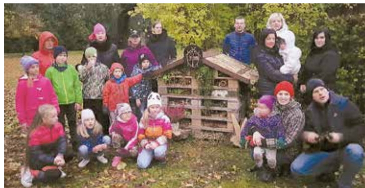
Bērnu un vecāku kopīgi darinātā kukaiņu māja.