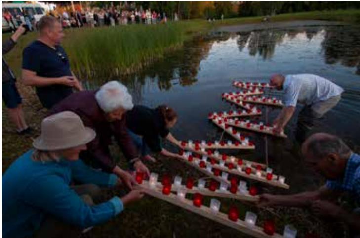
Lēdmanes pagasta svētku tradīcija – zīmes ielaišana ūdenī.

13. jūlijā visas dienas garumā Lielvārdes novada svētkus svinēja Lēdmanē. Rīts sākās ar sportiskām aktivitātēm, kurās iespēja bija piedalīties svētku apmeklētājiem visos vecumos. Tās ilga līdz pat plkst. 16.30. Paralēli tam un no plkst. 12.00 pie Lēdmanes tautas nama norisinājās interesantas un atraktīvas aktivitātes „Ģimeņu parkā”, ko piedāvāja draudzes „Gars un Patiesība” komanda.