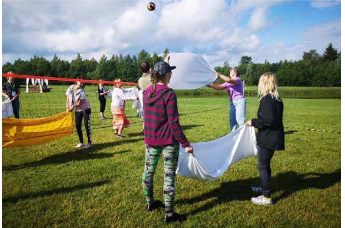
Nometnes dalībnieki sportošanas brīdī.

Nometnē bija ieradušies arī Valsts ieņēmumu dienesta Muiņas pārvaldes pārstāvji – nevis lai konstatētu pārkāpumus nodokļu jomā, bet gan lai iepazīstinātu ar dienes-