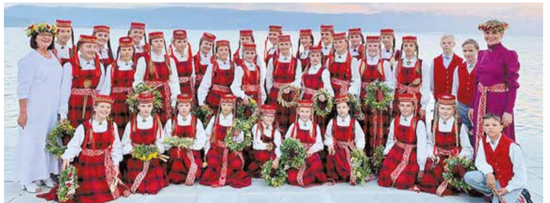
Koris "Lielvārde" tautastērpos un pašu pītājiem Ligo vaināgiem rokās pie ezera Maķedonijā.