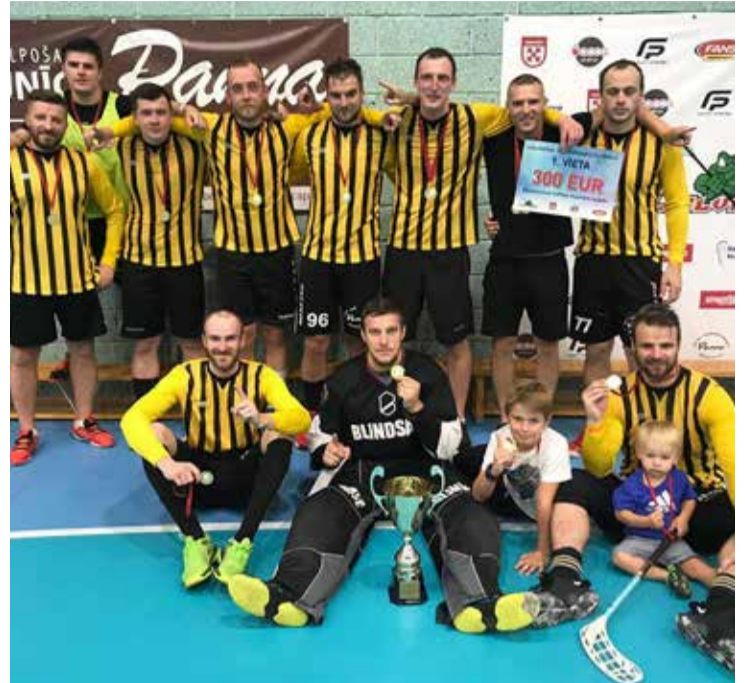
Čempionu komanda "Ervīns" ar izcīnītajām zelta medaļām.