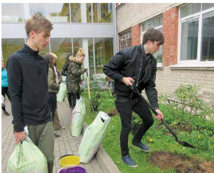
Rododendru stādīšana pie skolas.

Ekopadome bija apņēmusies veikt vides izvērtēšanu skolā un tās apkārtnē, tā nosakot, kādi darbi veicami, un pēc tam tos īstenot, kā arī iesaistīties pilsētas vides uzkopšanas darbos, jaunu apstādījumu veidošanā. Uzdevumu īstenošanā skolēni sadarbojās ar skolas pašpārvaldi un pilsētas jauniešu domi, vecākiem un pilsētas uzņēmējiem.