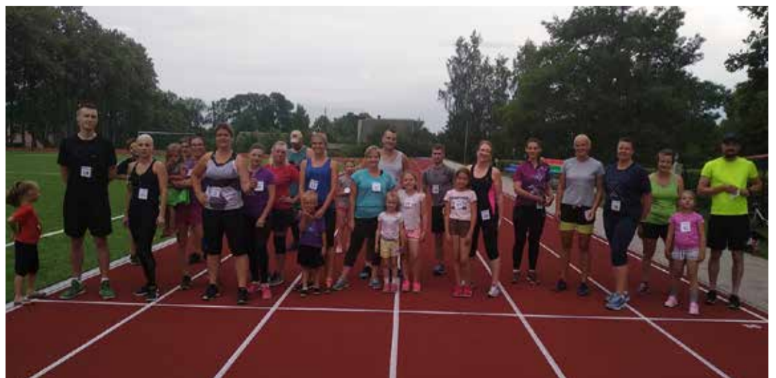
2. posma dalībnieki gatavojas skrējienam.

Agris Pikšens, biedrības "Visa Veida Kustība" vadītājs