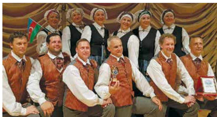
Saime festivāla noslēgumā ar saņemto diplomu un kausu.

Vislielāko ekskursijas daļu kolektīvs pavadīja galvaspilsētā Baku, Kaspijas jūras piekrastē, apskatot