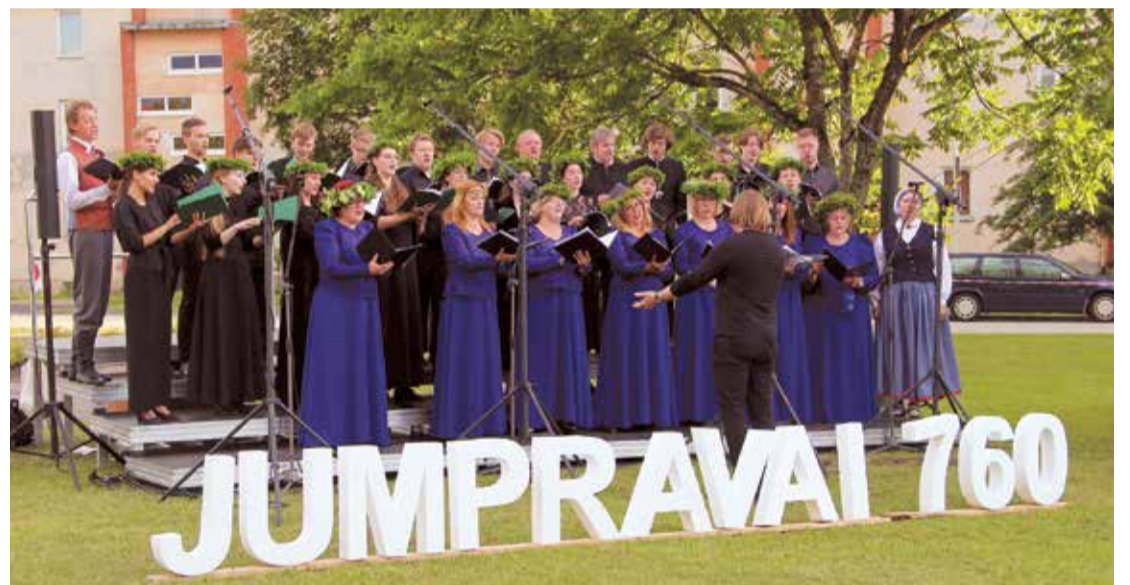
Svētku koncertā “Jumpravai 760” uzstājās Jumpravas amatiermākslas kolektīvi un viesi.

Jumpravas pagastā 6. jūlijā mājīgi un sirsnīgi tika ieskandināti Lielvārdes novada svētki. Turklāt šogad svētki jo īpaši bija tādēļ, ka vienlaikus tika atzīmēta arī Jumpravas 760 gadu jubileja. Šodien Jumpravas pagasts ar teju diviem tūkstošiem iedzīvotāju ir lielākais Lielvārdes novadā, bet pašas Jumpravas vislielākā rota, protams, ir jumpravieši.