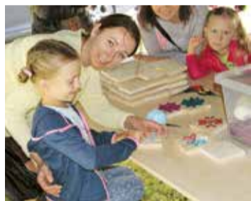
Radošajās darbnīcās bija iespēja izveidot savu Rīta zvaigzni jeb Auseklīti.

mieru un harmoniju. Jumprava nav tikai mājas, tilti, baznīca un ielas, kas tiek sakārtotas. Jumpravas pagasta vērtība ir cilvēki, kuri šeit dzīvo un to veido. Novēlu, lai jums Jumprava ir vieta, kur katru rītu tikties un no sirds vēlēt labu dienu. Jumpravas pagasta dzimšanas dienā vēl jums prieku – prieku dzīvot, prieku strādāt, prieku sasniegt turību, sadzirdēt vienam otru, spēju mainīties un novērtēt pārmaiņas. Novēlu jums, lai skaisti gan svētki, gan ikdiena Jumpravā. Daudz laimes dzimšanas dienā!"