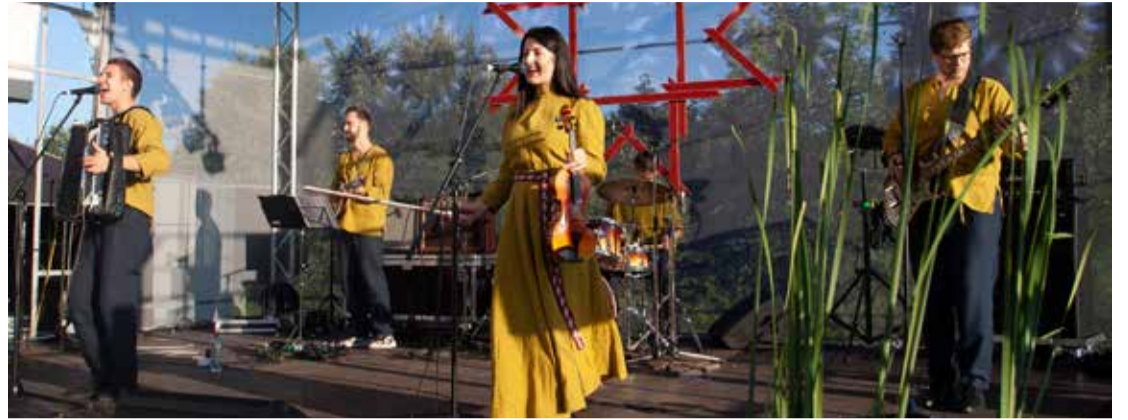
Ar koncertu „Rotā saule” uzstājas postfolkloras grupa „Rikši”.