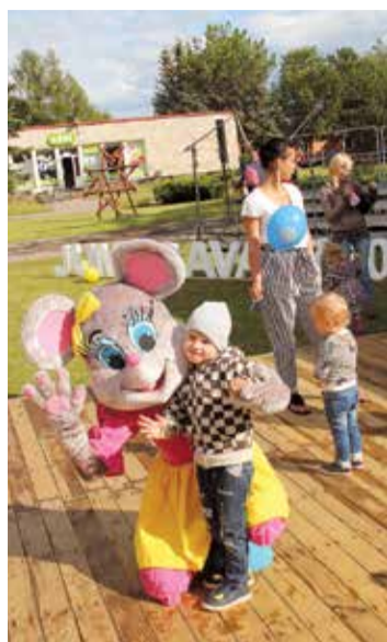
Padomāts arī par mazākajiem svētku apmeklētājiem – ziepju burbuli, rotaļprogramma un pasaku tēli.