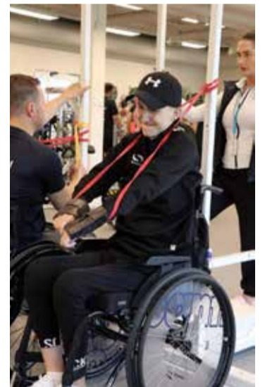
Elvis nav gatavs padoties. Viņš cītīgi strādā, lai sasniegtu savu mērķi – spēt atkal staigāt.