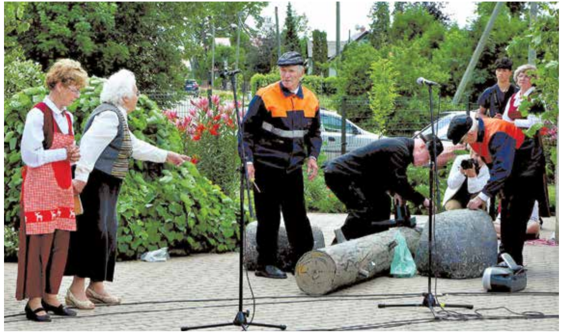
Skats no Agra Liepiņa lugas "Darbs lielu dara" izrādes.

jām. Teātris "Paši" izspēlēja Agra Liepiņa lugu "Darbs lielu dara" (režisore Skaidrīte Tilaka), iesais-