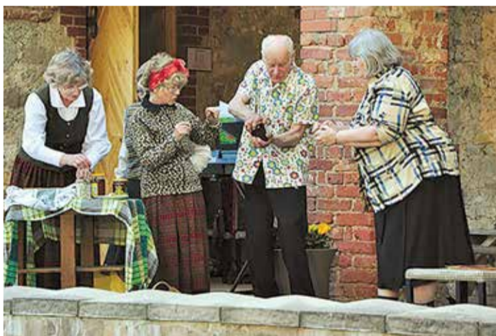
LPB Senioru teātra „Paši” jauniestudējuma pirmizrāde „Muzeju nakts” vakarā Agra Liepiņa lugai „Darbs lielu dara” ar 40 aktieru, dziedātāju, dejotāju kopdarbu.

Senioru dziesmu ansambļi „Lielvārdietes” apguva dziesmu repertuāru, piemērojot un atbals-