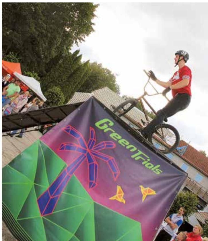
Ar galvu reibinošiem trikiem pārsteidza "Greentrials" velo šova puiši.

dienlaika Jumpravas centrā sākās kultūras programma – koncerti, sarunas, rotaļprogramma bērniem ar pasaku tēliem un burbulbrīnumiem, "Greentrials" velo šovs. Un vakarā neiztrūkstošais svētku koncerts, kurā piedalījās Jumpravas amatiermākslas kolektīvi un viesu koris no Rīgas. Pēc koncerta lustīgu balli nospēlēja grupa "Džentlmeņu špagats" un DJ MFZ. "Jumpravas kultūras nams vēlas pateikt paldies ikvienam, kas piedalījās svētku radīšanā – Jumpravas pagasta pārvaldes darbīgajiem cilvēkiem, kuri ar darbīgajām rokām izdara visu, kas nepieciešams. Jumpravas jauniešu domes brīvprātīgie ir lieli un vērtīgi palīgi, kuri vienmēr ir ļoti atvērti un aktīvi piedalās pasākumu radīšanā ne tikai reizi gadā vien. Jumpravas amatiermākslas kolektīvi ir mūsu zelts – vienmēr kuplina svētkus un priecē ikvienu ar dejām un dziesmām, tādēļ paldies kolektīvu vadītājiem par spēcīgo kolektīvu uzturēšanu. Paldies