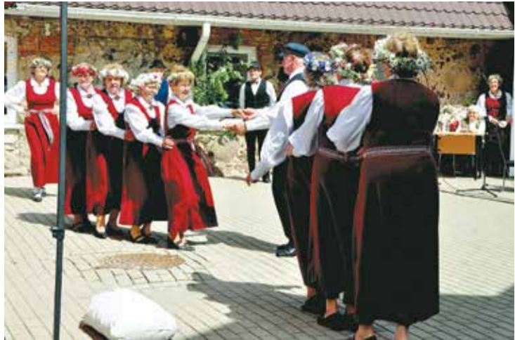
Dejo "Sidrabotie gadi".