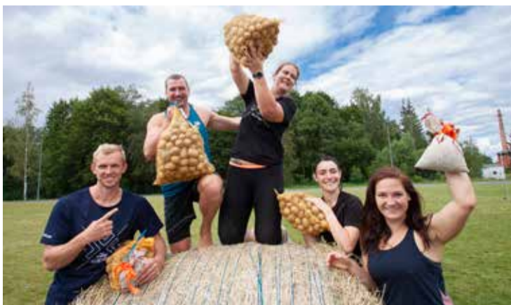
Siena ruļļu velšana, basketbols, volejbols un stafete "Lauku sēta" – sporta aktivitātes ir neatņemama svētku sastāvdaļa.