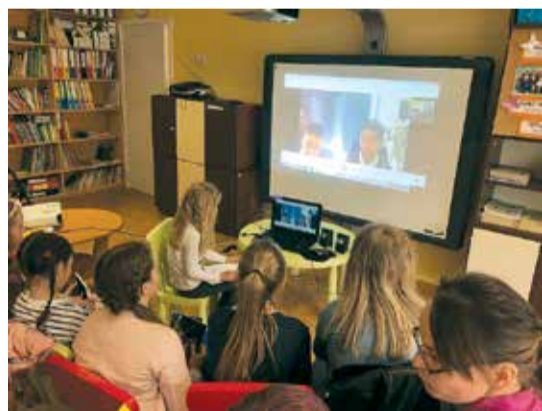
Pirmā video tiešraide, kuras laikā projekta dalībnieki iepazīstas viens ar otru, uzdod jautājumus par skolu, par bērnu ārpusstundu aktivitātēm, par interesēm, par valsti.