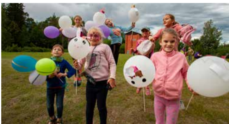
Prieģīgi bija arī svētku jaunākie apmeklētāji.