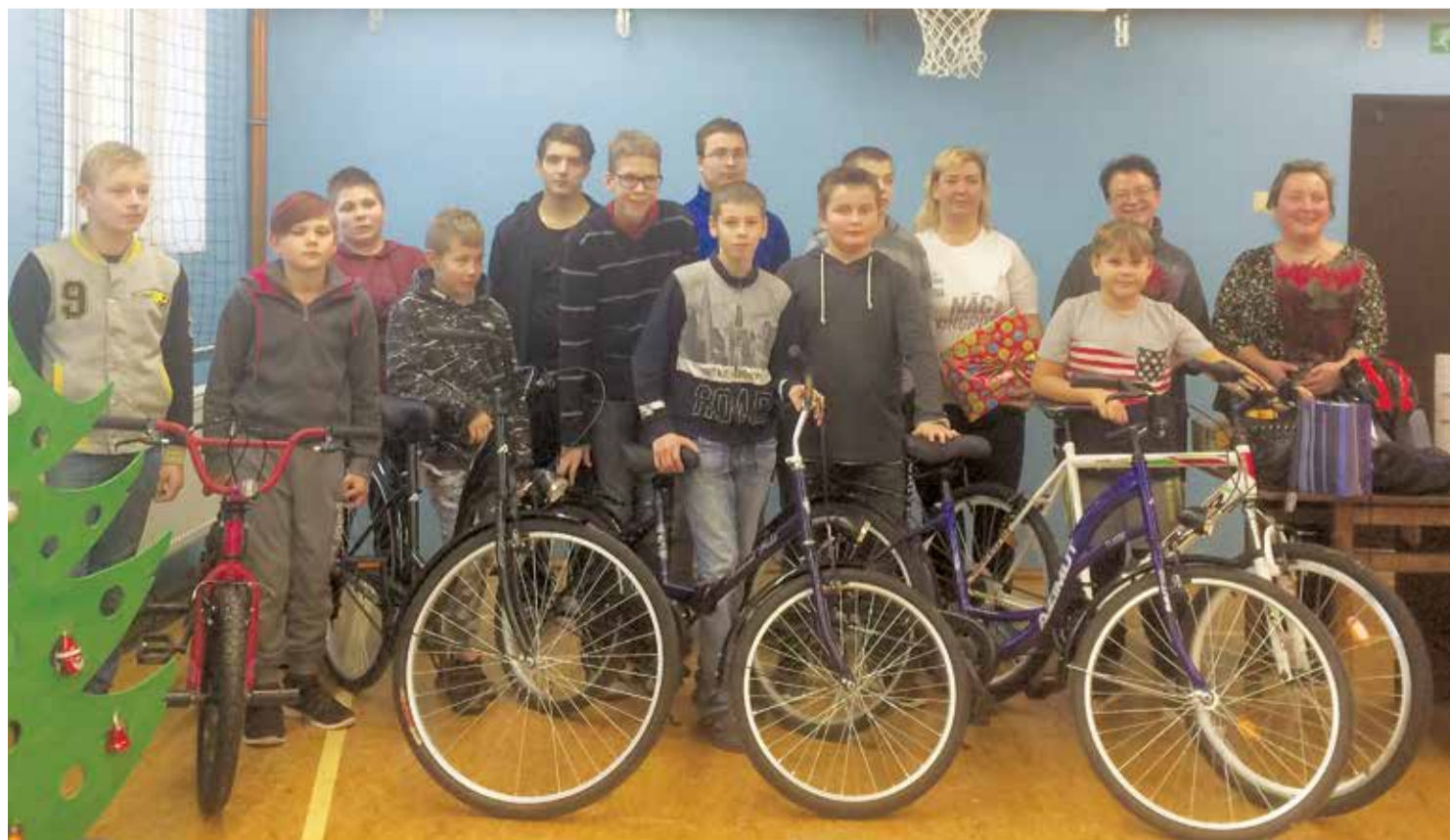
Velosipēdistu tiesību ieguvēji.