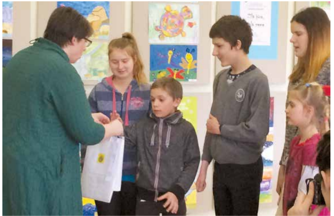
Vizuālās un vizuāli plastiskās mākslas izstāde – konkurss „Krāsainās domas”.