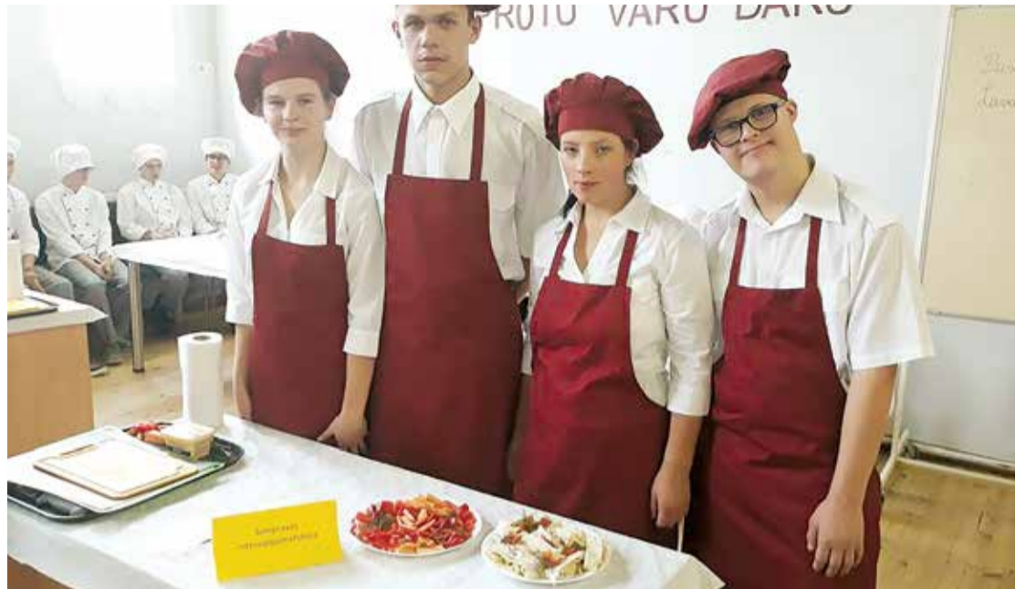
Pavāru palīgu konkursā „Protu, varu, daru”.

Ari skolā notiek mācību priekšmetu tematiskie pasākumi. Atraktīvā veidā tiek papildinātas izglītojamo prasmes un iemaņas matemātikā, logopēdijā, mūzikā, vēstu-