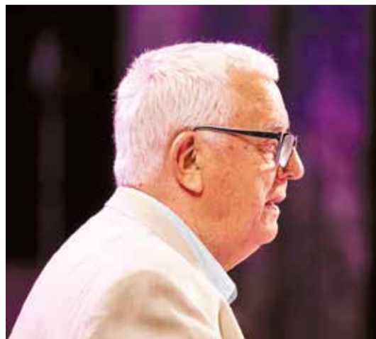
Vakara īpašais viesis – Maestro Raimonds Pauls.