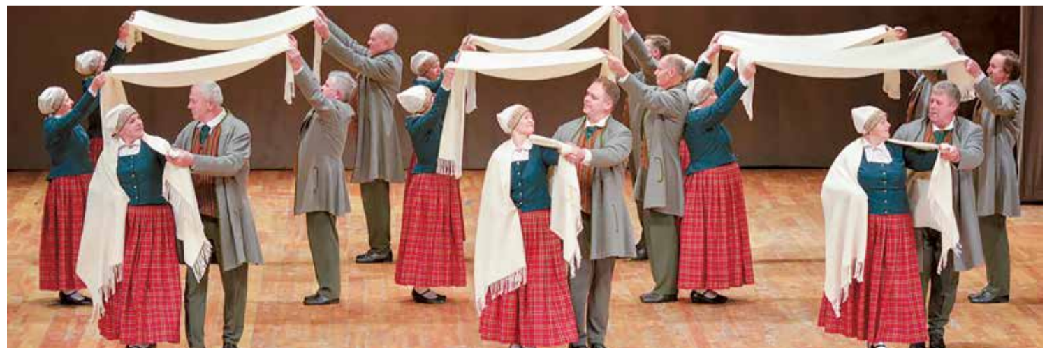
Senioru deju kolektīvs “Lēdmane” uzstājas jaunrades deju konkursa finālā Valmierā.