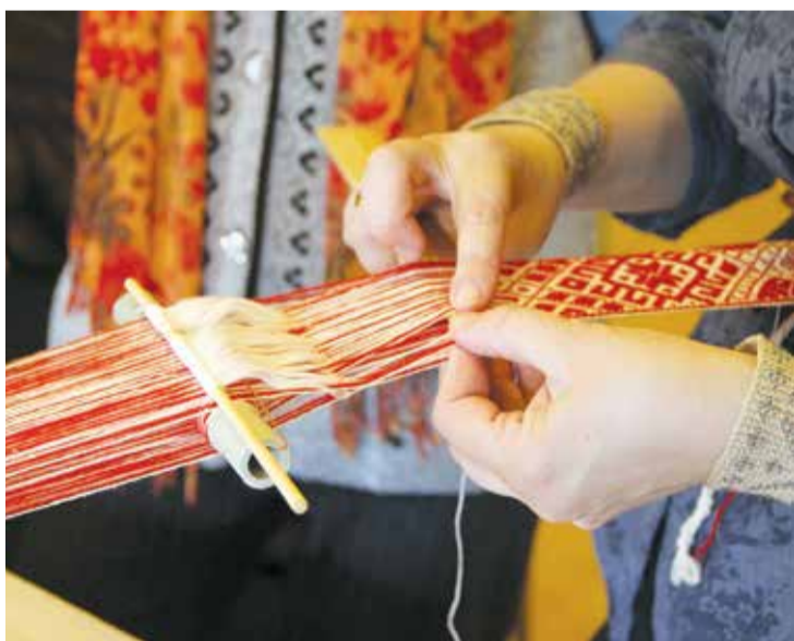
Lielvārdes josta, kas top bez stellēm.