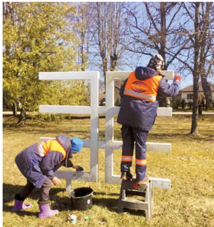
SIA "Lielvārdes Remte" darbinieces spodrina latvju zīmes pie Rembates parka.

Lielvārdes novada pašvaldība aprīli ir pasludinājusi par Spodrības mēnesi, tāpēc iedzīvotāji aicināti ne vien Lielās talkas laikā – 27. aprīli, bet visa mēneša ietvaros sakopt savus īpašumus un iesaistīties publiski pieejamo teritoriju sakopšanā, domājot par novada kopējo tēlu.