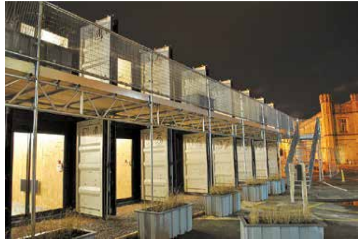
Koprades telpas piemērs „Boxwork” Bristolē.

Rezumējot dzirdēto un redzēto Anglijā, secināms, ka koprades telpām ir vairāki piesaistoši faktori: darbs kopīgā telpā veicina jaunu ideju rašanos; iespēja strādāt gan īslaicīgi, gan ilgtermiņā – tik ilgi, cik nepieciešams; telpa apvieno dažādu jomu speciālistus, kas veicina jaunas iepazīšanās, iedvesmu un