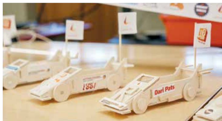
Automodeļa rasējums visiem vienāds, taču izpildes kvalitāte un “tūninga” risinājumi katrai komandai atšķirīgi.