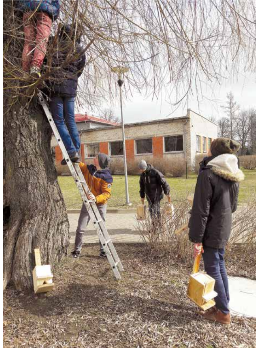
Skolas zēni izvieto pašu gatavotos putnu būrišus.

Klāt aprīlis – Putnu mēnesis. Mums ir, ar ko lepoties, jo Latvija bija pirmā valsts, kura 1928. gadā aizsāka šo tradīciju. Eiropā to sāka atzīmēt tikai 1993. gadā. Putnu dienas notiek divas reizes gadā, pavasarī un rudenī. Latvijā ir novēroti un konstatēti vidēji 60 000, 4 miljoni putnu. Putnus vēro 70 bet Eiropā – kopumā vairāk nekā valstīs. Mūsu skolas zēni māju-