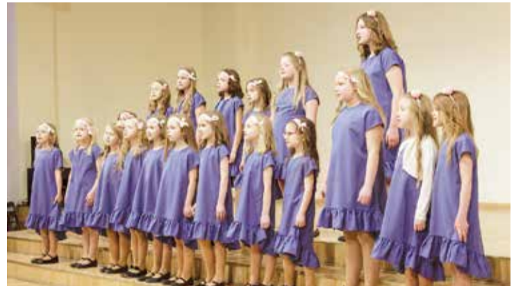
Jumpravas pamatskolas 1.-4. klašu koris.