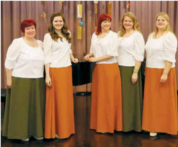
Lēdmanes dāmu ansamblis „Stari”.

starp tās dienas konkursa dalībniecēm, iegūstot 1. pakāpes diplomu ar 44,50 punktiem, pavisam nedaudz atpaliekot no augstākās pakāpes vērtējuma (45 punkti).