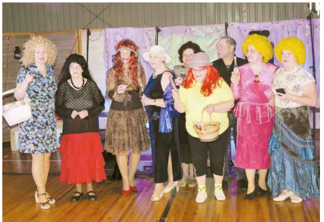
Dāmu deju kopa “Dīva” saposusies koncerta 2. daļai – priekšnesumam.

Inese Nereta, LdNKC Lēdmanes tautas nama vadītāja