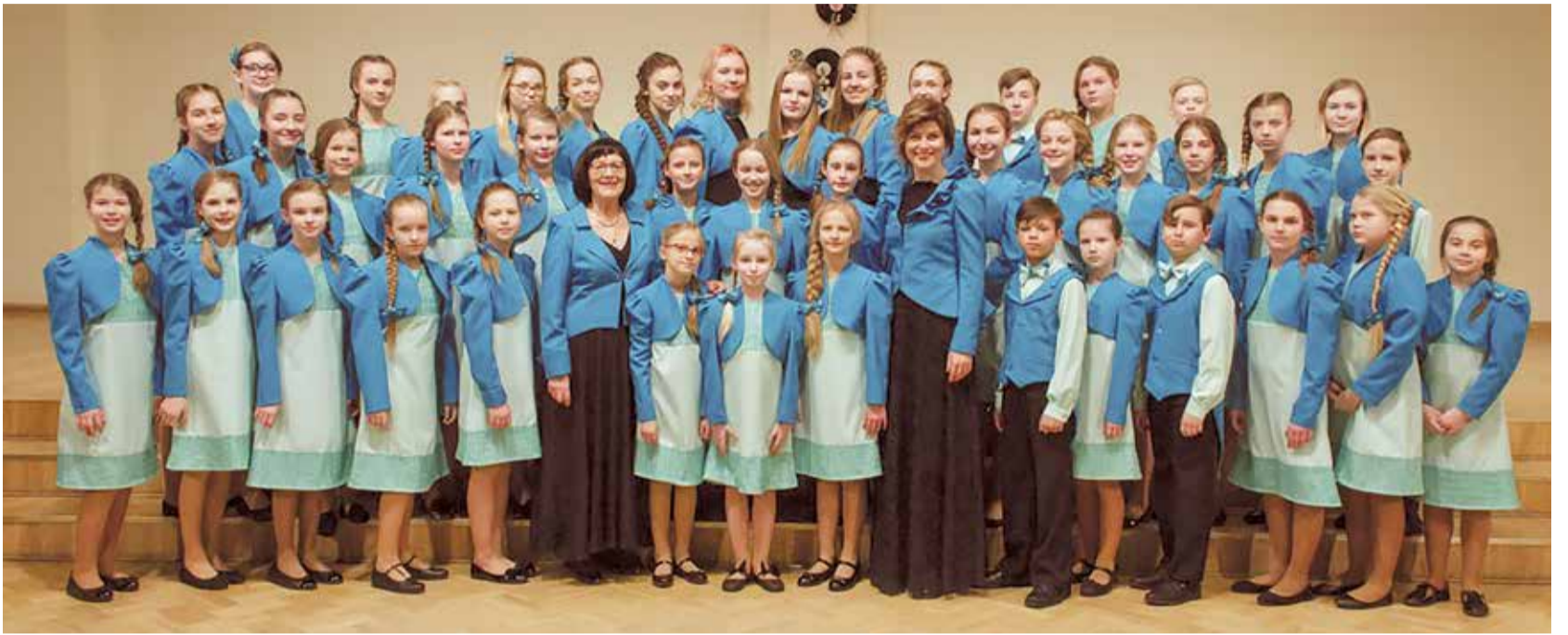
LNMMMS bērnu koris "Lielvārde".

Zane Aperāne, informācijas līdzekļu redaktore