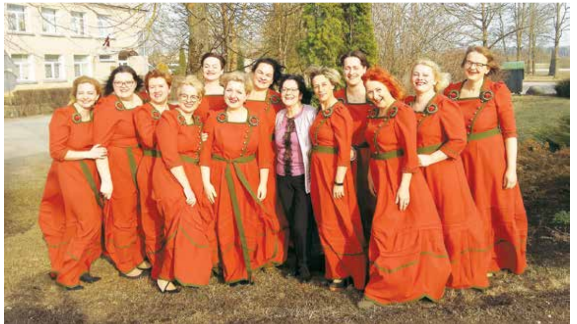
Dāmu ansamblis „Pusnakts stundā”.