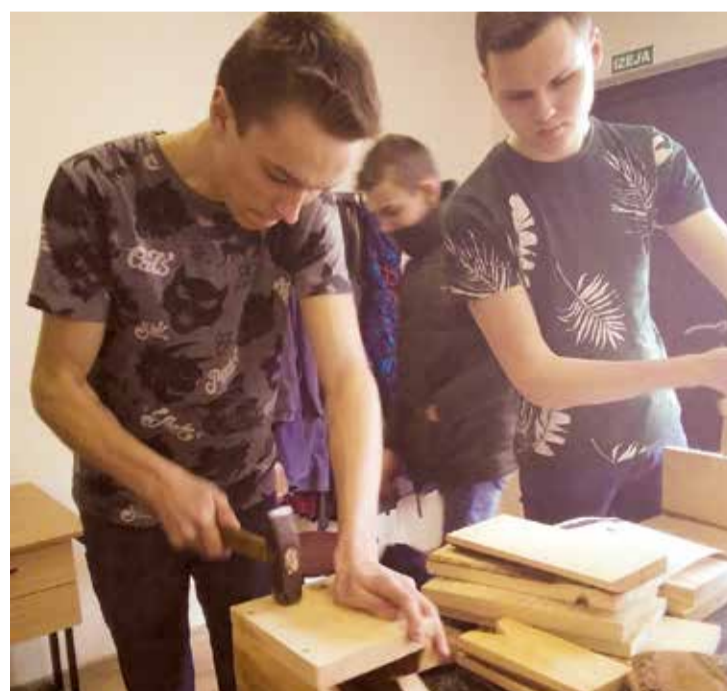
Zēni, aizrāvušies ar putnu mājokļu gatavošanu.