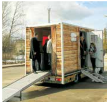
Aprūpes mašīna aprīkota ar ērtām un vieglām alumīnija kāpnēm un uzbrauktuvi.

nas pašaprūpes spējas. Personai piešķiramā aprūpes mājās pakalpojuma apjoms tiek noteikts četros līmeņos.