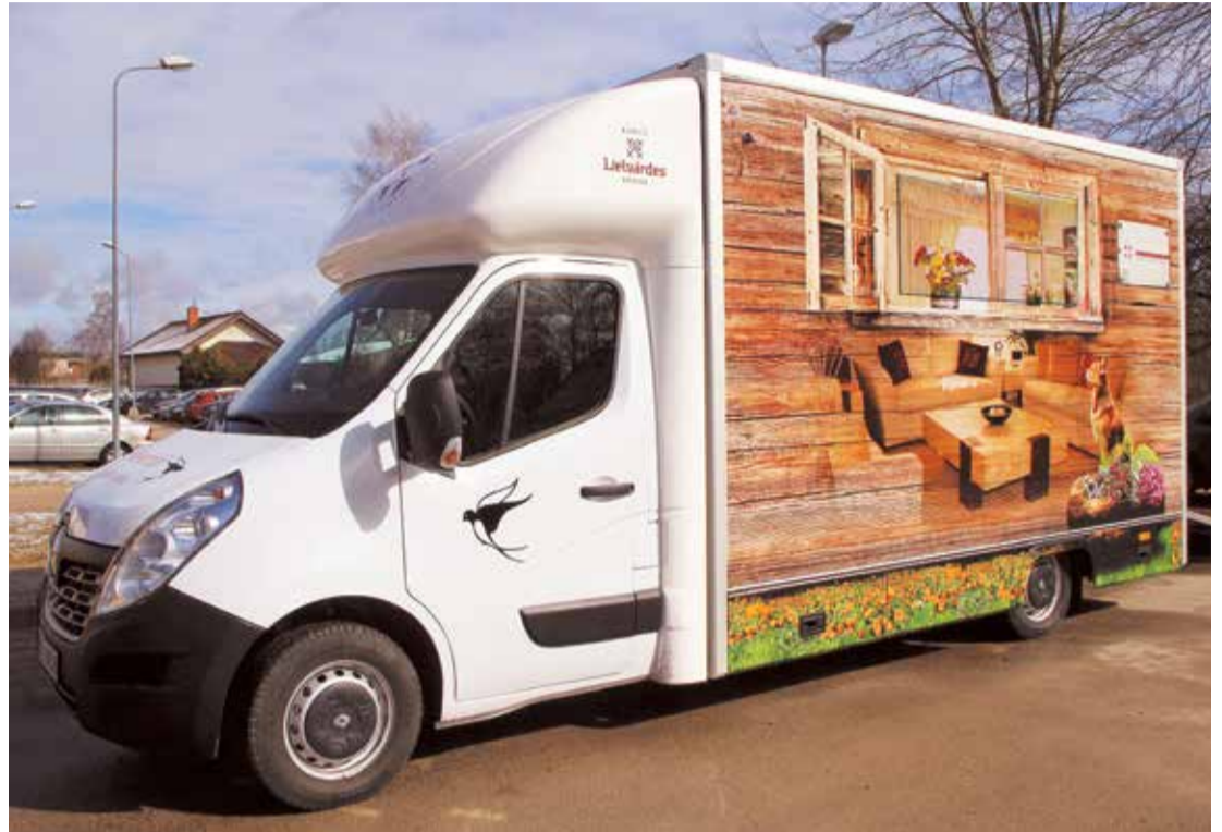
Jaunais auto nodrošinās aprūpes pakalpojumus aptuveni 150 iedzīvotājiem Lieltvārdes, Ķeguma, Aizkraukles, Skrīveru, Kokneses un Ogres novadā.

Kā norāda Lieltvārdes novada Sociālā dienesta pārstāvji, pakalpojums "Aprūpes mājās" paredzēts klientam, kurš slimības laikā vai atveseļošanās periodā vecuma, fiziska rakstura traucējumu dēļ nevar veikt ikdienas mājas darbus un savu personisko aprūpi un kuram nav likumisko apgādnieku, vai arī tie objektīvu apstākļu dēļ nespēj sniegt minētajam klientam nepieciešamo palīdzību. Aprūpes mājās pakalpojumi ietver personas minimāli nepieciešamo aprūpi, izvērtējot katras perso-