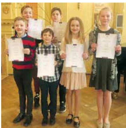
Novada dižākie smidzinātāji pēc lielā fināla vienojušies kopbildē.

Pēc konkursa Airitu un Esteri uzrunāja Latvijas Radio raidīju-