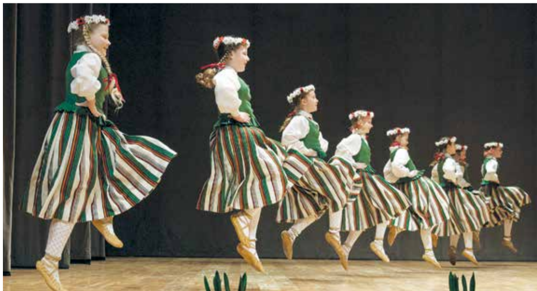
"Pūpolīša" 4.-5. klašu grupas uzstāšanās skatē.