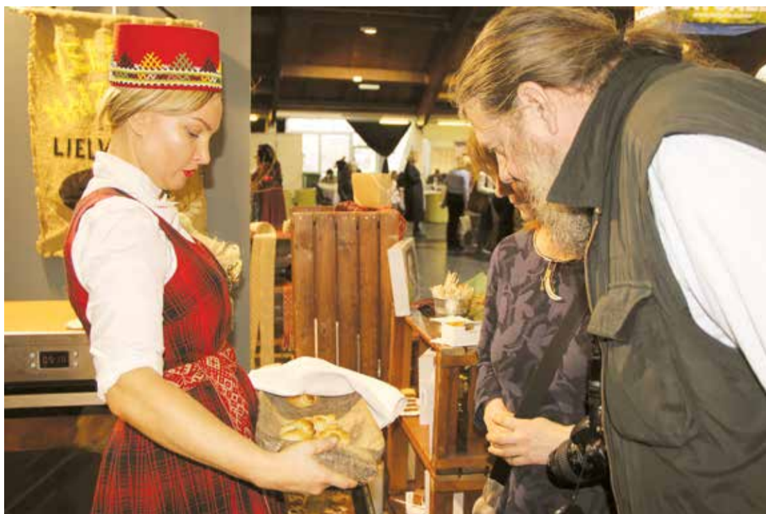
"Zelmas maiznīcas" pārstāve piedāvā tikko ceptus pīrāgus tūrisma izstādes "Balttour" apmeklētājiem.

Par aizraujošām un izzinošām aktivitātēm bērniem Lielvārdē rūpējas interešu izglītības centrs "Lielvārdi", kas labprāt uzņem skolēnu un tūristu grupas, kā arī ģimenes, lai caur dažādām praktiskajām nodarbībām veicinātu dabisko zinātkāri par sevi, apkārtni un pasauli