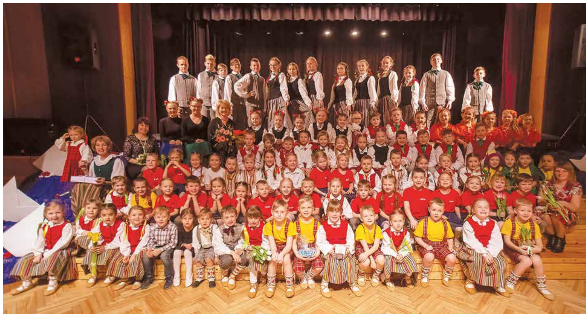
Visi koncerta "Zeme laimīgā" dalībnieki.