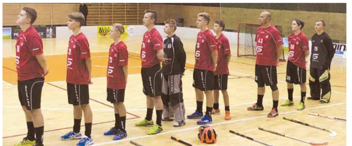
Pirmās līgas florbola komanda.

Kopvērtējumā 1.vietu izcīnīja „Rembate” (komandā spēlē-