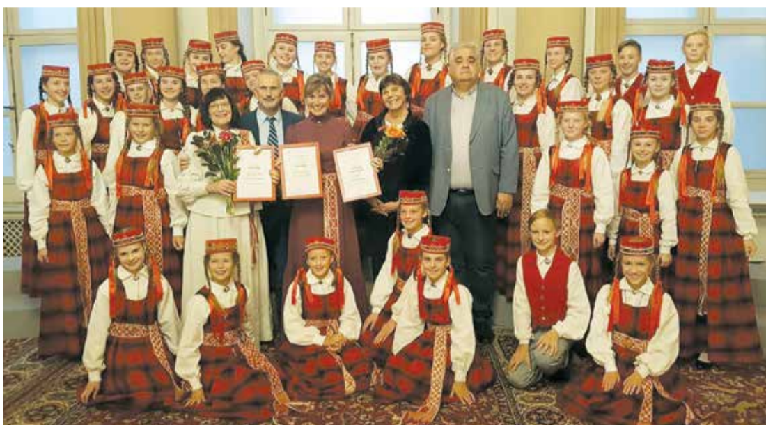
Koris „Lielvārde” ieguva Grand Prix, saņemot 98 punktus no iespējamajiem 100!

Koris „Lielvārde” ieguva Grand Prix, saņemot 98 punktus no iespējamajiem 100! Festivāla žūrija uzslavēja bērnu kora balsi skaņņejumu, atraktivitāti, emocionalitāti un tehnisko varēšanu, izpildot sarežģītu mūsdienu kora mūziku. Tika uzsvērti arī pareiza konkur-