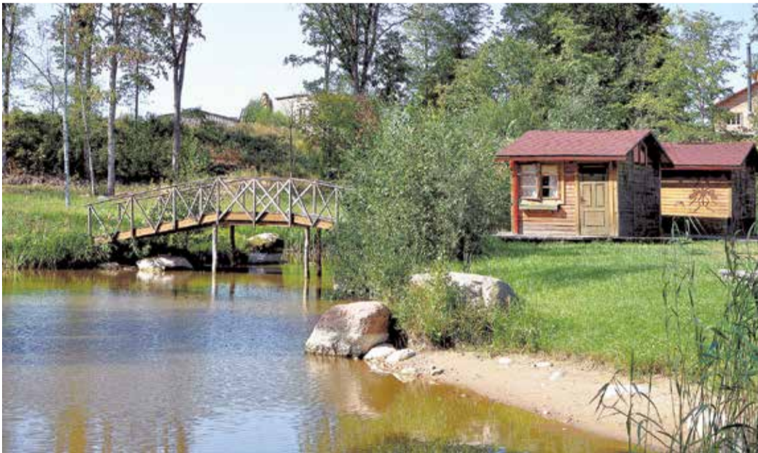
Otrā un trešā diena aizritēja Zilā krusta iekārtotajā atpūtas nometnē Lēdmanē. Ar prieku izbaudījām Latvijas dabas skaistumu.