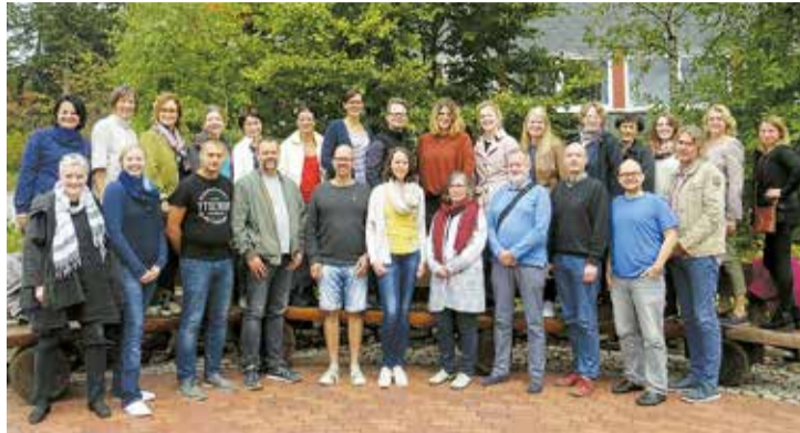
Semināra "Zertifikātskurs Europakompetenz" dalībnieki.

Izmantojot mācību metodi "Pasaulē kafejnīca" (World cafe), pastāstīju par ES vērtību iekļaušanu mūsu skolas mācību darbā. Tā bija iespēja informēt par projekta "Eiropas Parlamenta Vēstnieku skola" īstenošanu. Vācijā ir termins "Eiropas skola", kura iegūšanai ir jārealizē sadarbības projekts ar kādu Eiropas skolu. Seminārs dod iespēju nodibināt kontaktus ar pedagogiem, lai vēlāk varētu izveidot projektu, kurā atspoguļojas seminārā apgūtās zināšanas. Vārdos sadarbība šķita viegli veidrojama, bet praksē ir jāreķinās ar vairākiem sarežģījumiem, par kuriem mums stāstīja projek-