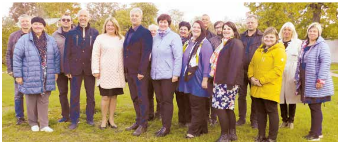
Ogres un Lielvārdes pašvaldību pārstāvji un uzņēmēji ar Alojā novada saimniekiem Staicelē.

Pēcpusdienā saimnieki piedāvāja apskatīt Staiceles. Priecājāmie par rūpīgi sakopto mazpilsētas centru ar 19.gs. beigū un 20.gs. sākuma koka apbūvi. Aizraujoša bija īsā ekskursija Staiceles lībiešu muzejā „Pivāliņd”. Te izveidota digitāla seno un joprojām esošo māju karte, iekārtots arī vēsturisks