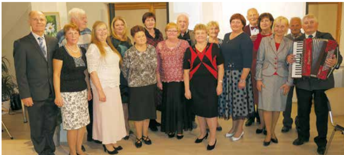
Bijušā kolhoza „Lēdmane” darbinieku Atmiņu vakarā.

Septembra pēdējās nedēļas nogalē, 28.septembrī, tautas