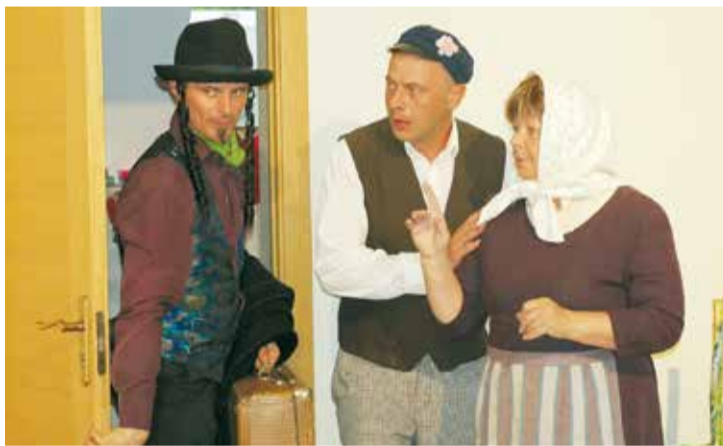
Lielvārdes tautas teātra izrāde „Icīgs Mozes” Lēdmanes tautas namā.