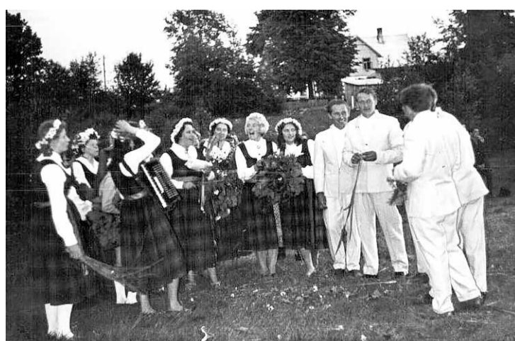
Lai arī Līgo svētki padomju okupācijas laikā bija teju vai aizliegti, tomēr to svinēšana īpaši lauku apvidos notikusi vienmēr. Attēlā – jumpravnieki pulcējas Līgo svētkos 1964. gadā.