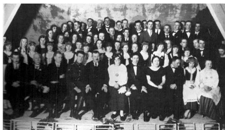
Kultūras dzīve Jumpravā ir situsi augstu vilni gadsimtu garumā. Attēlā – atjaunotā Labdarības biedrības nama atklāšana Jumpravā 1924. gadā.