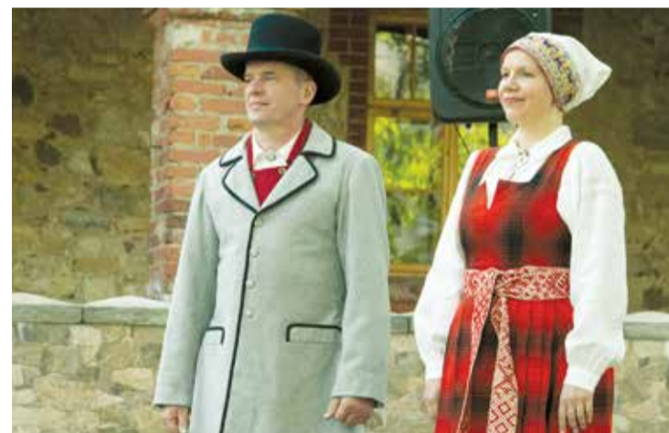
Lāčplēša dejotāji jaunajos, krāšņajos tērpos.

studijas, biedrības, SIA un citas personu grupas darināto tautastērpu un bērnu tautastērpu. Tautastērpu skatē galvenie kritēriji ir – tautastērpa kopskats, kvalitātes un komplektējuma atbilstība valkātāja augumam, atbilstība kultūrvēsturiskajam novadam un izvēlētajam laika periodam, kā arī tautastērpa atbilstība kolektīva darbībai. Šādā skatē savu dalību piesaika arī biedrība "Lāčplēsis dejo" un VPDK "Lāčplēsis" ar saviem jaunajiem Lielvārdes novada 19.gs.