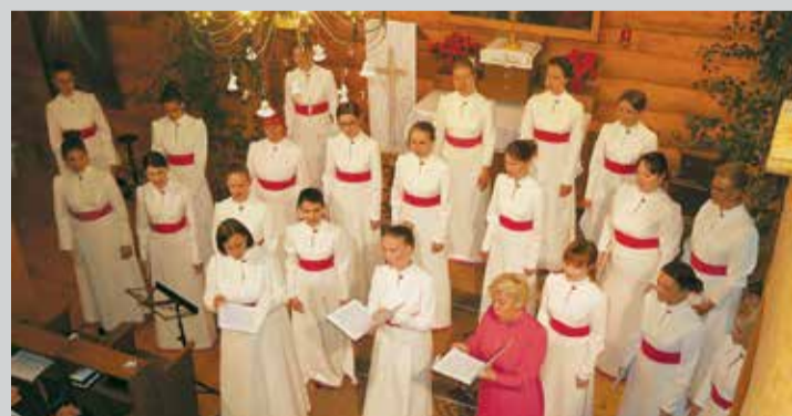
Baznīcu nakts Lēdmanes dievnamā, dzied Vecumnieku tautas nama jauniešu koris "Via Stella".

Arī Lēdmanes dievnams, sadarbībā ar blakus esošo tautas namu, bija sagatavojis aktivitāšu programmu, kurā draudze varēja radīt citāda veida tikšanās iespēju ar kristīgo vēsti. Vakara gaitā viesiem un draudzes locekļiem bija iespēja piedalīties dievkalpojuma, radošajā darbnīcā, kurā varēja apgleznot stikla traukus gaismas lukturu veidošanai, erudīcijas spēlē, kurā bija jāatbild uz jautājumiem par Lēdmanes baznīcu, saņemot vērtīgu balvu, meditatīvu stāstu lasījumos un garīgu dziesmu dziedāšanā. Koncertos dvēselisko baudījumu sniedza Aizputes novada, Cīravas pagasta