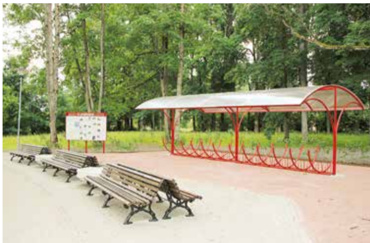
Jaunā velosipēdu novietne.

Līga Zarīna, Lielvārdes novada izpilddirektores vietniece