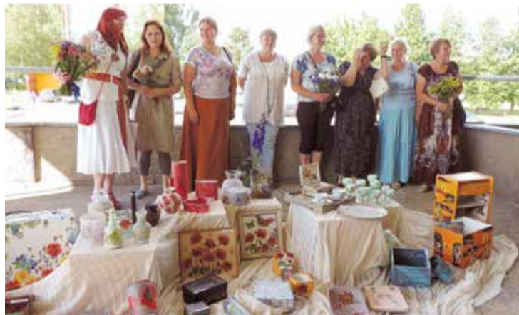
Lēdmanes svētkos neizpaliek ne radošās darbnīcas, ne vietējo ļaužu amatnieku darinājumu tirdziņš.

piedāvājam līdzdarboties. Pēc svētkiem iedzīvotājus aicinām izteikt viedokli aptaujā. Tomēr ne tikai pēc aptaujas rezultātiem uzzinām svētku apmeklētāju patiku vai neapmierinātību, atsauksmes sasniedz mūs jau labu laiku pirms uzzinām aptaujas rezultātus. Jebkurā gadījumā organizatoriem šis viedoklis ir svarīgs un gadu no gada strādājot, tas tiek ņemts vērā." ❖