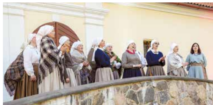
Sadziedāšanās Cēsu pils pagalmā.

Vakara gaitā koncerti notika pamīšus uz divām skatuvēm –