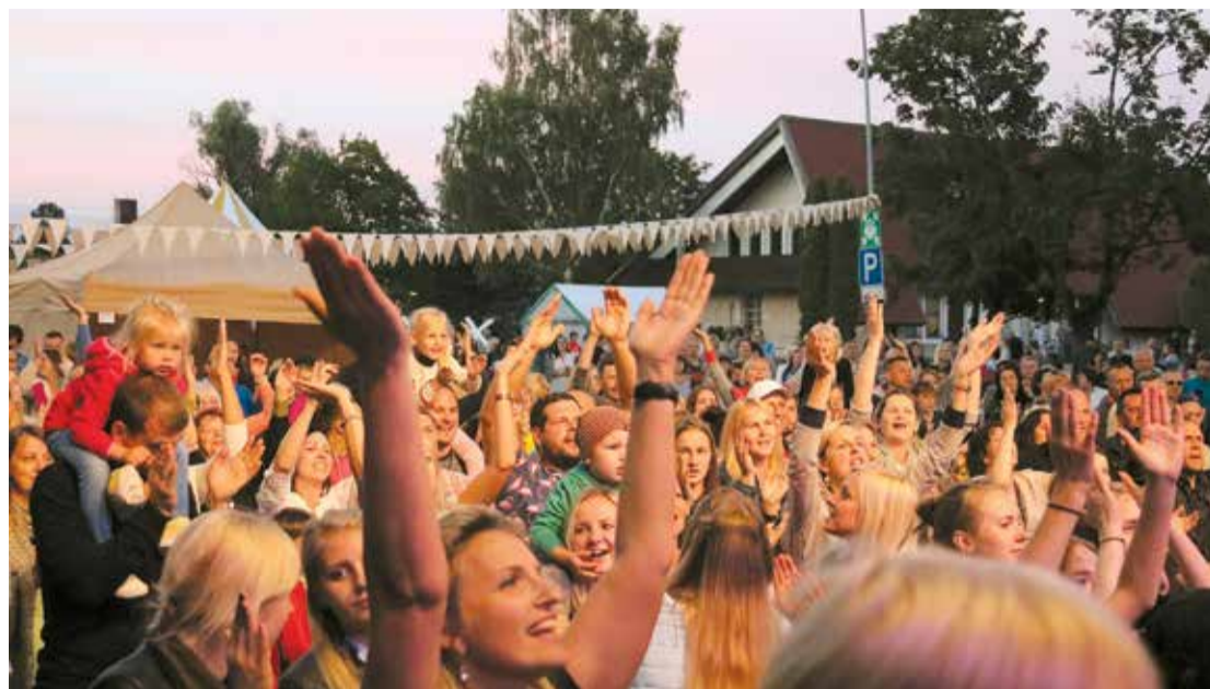
Pagasta svētki Jumpravā ar katru gadu pulcē arvien vairāk un vairāk apmeklētāju. Jumpravieši arī šogad aicina – brauciet, sviniet un izbaudiet “Zīmju ceļu”.