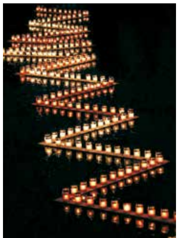
Jau divus gadus Lēdmanē ir jauna aktivitāte – latvju ugunīgās zīmes ielaišana centra diķī. Bērni skrūvē sveču kausiņus pie koka konstrukcijas, kas izveidota kā latvju zīme. Pagasta iedzīvotāji dedzina sveces un ievieto tās kausiņos, un tad kopīgi ieceļ koka konstrukciju ar svecēm diķī. Tā ir emociju un sajūtu bagāta aktivitāte, ko īpaši iecienījuši lēdmanieši. Arī šogad tradīcija tiks turpināta.