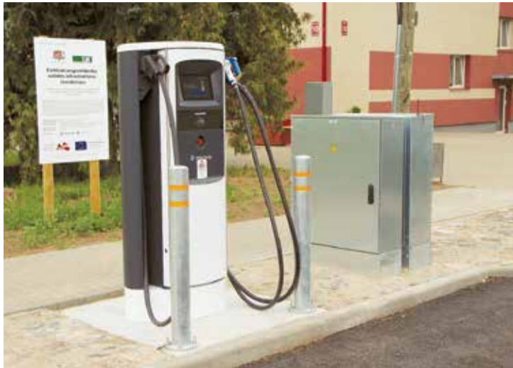
Elektromobiļu ātrās uzlādes stacija Skolas ielā.

Benita Šteina, Būvvaldes teritorijas plānotāja