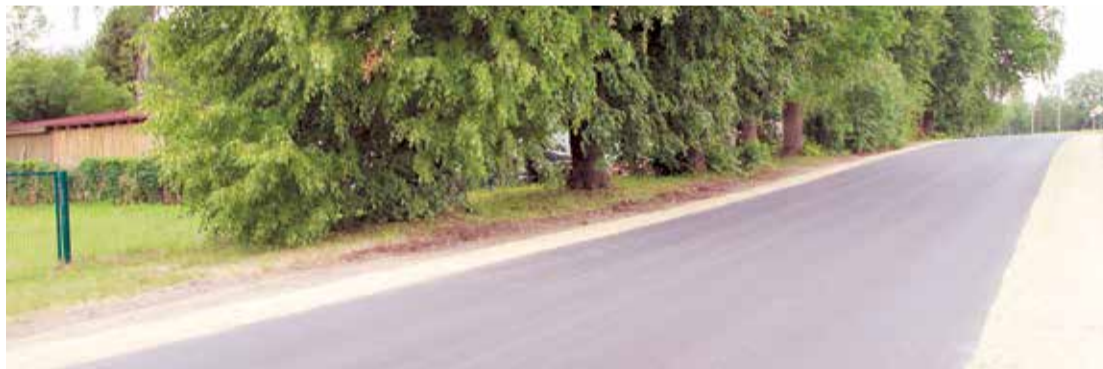
Jaunuzklātais asfalta segums Uzvaras ielā.