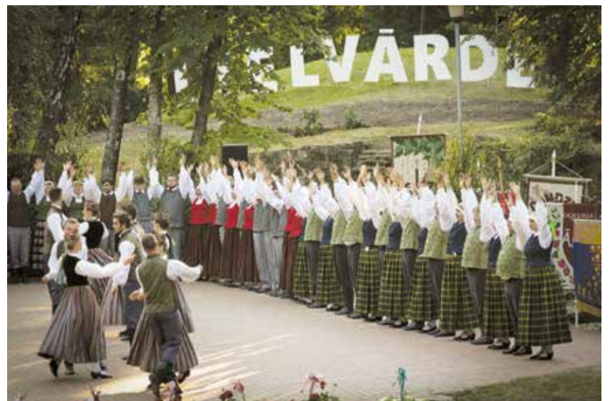
Dejotpriekš Lielvārdē vieno vairāk nekā 600 dejotājus.

Deju svētkos "Latvija – Māras zeme" piedalījās jauniešu deju kolektīvi: "Jumpraviņa", "Spiets", "Spāre", "Ābelzieds", "Pūpolītis", "Solis", "Dzīpari", "Pīlādzītis"; vidējās paaudzes deju kolektīvi: "Vēji", "Saimē", "Sunta", "Lāčplēšis", "Degsme", "Aija", "Lustīgais", "Dandzis", "Made", "Līčupīte"; senioru deju kolektīvi: "Veldze", "Ogrēnietis", "Sumulda", "Lēdmane", "Suncele",