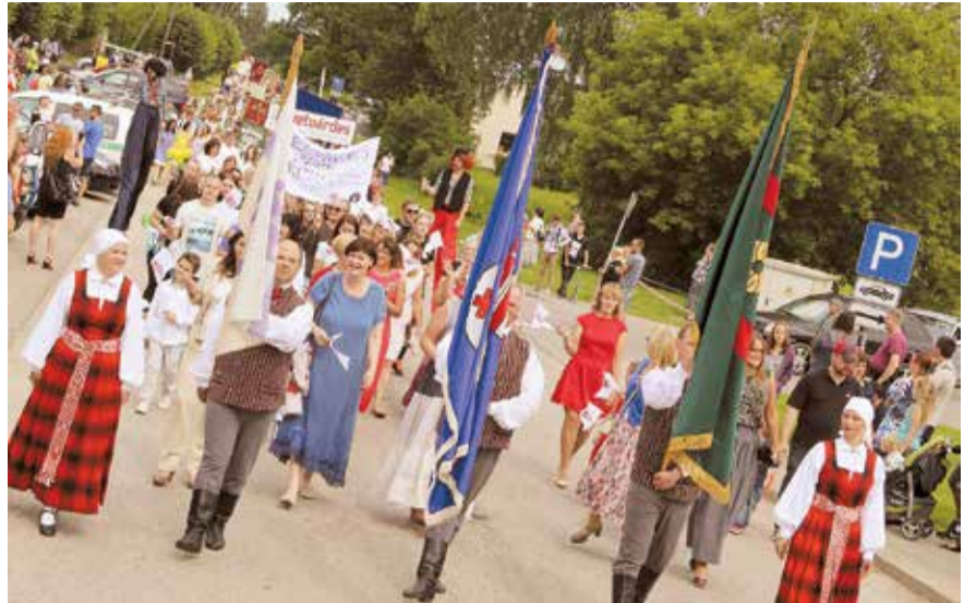
Novada svētku gājiens Lielvārdē 2017. gadā.