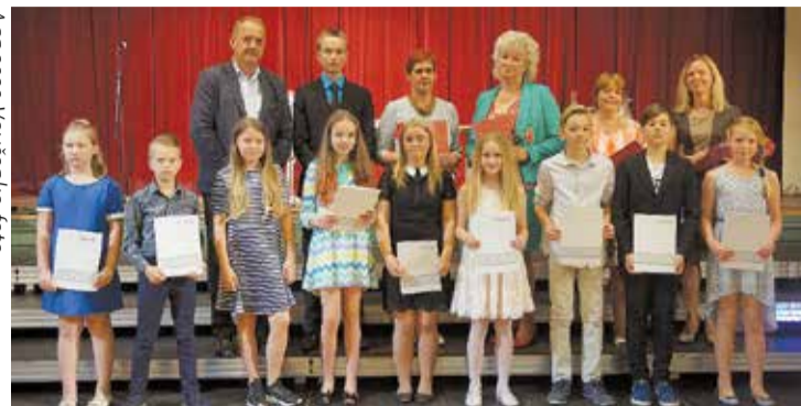
Lielvārdes pamatskolas pedagogi un skolēni.

Olimpiāžu un konkursu uzvarētāju apbalvošanas pasākumā Lielvārdes novada pašvaldi-