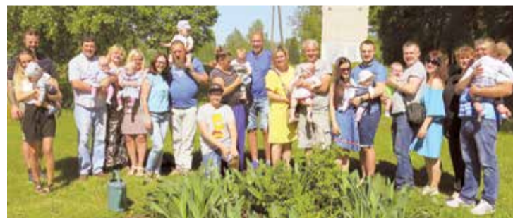
Rozes sastādītas – laiks svētku kopbildei.

Ar labiem vēlējumiem ģimenes sveica Lielvārdes novada domes